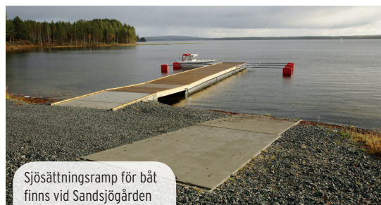
Sjösättningsramp för båt finns vid Sandsjögården

Torrdass finns vid norra vindskyddet vid Sandseleforsarna och vid rastplatsen/fiskeplatsen vid Juktån.