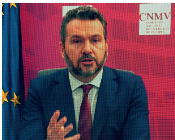
Rodrigo Buenaventura pidió al Ejecutivo eliminar barreras a la inversión.

El presidente de la Comisión Nacional del Mercado de Valores (CNMV), Rodrigo Buenaventura, dedicó su intervención en el SID a analizar el factor estratégico de los mercados de valores en la recuperación económica: “Los mercados de valores se han constituido como uno de los pilares fundamentales de las economías modernas y tienen que continuar siéndolo. Son una de las principales herramientas para impulsar la recuperación y la transformación de la economía y de la digitalización, que requieren importantes inversiones”.