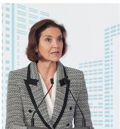
Reyes Maroto , ministra de Industria, Comercio y Turismo

"El Gobierno está fuerte y unido en pro de la recuperación"