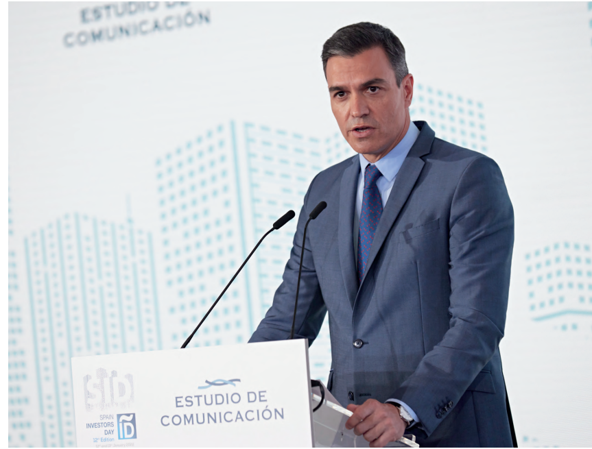
Pedro Sánchez se dirige a los asistentes a la sesión de clausura.

"España es y seguirá siendo un lugar muy atractivo para la inversión internacional"