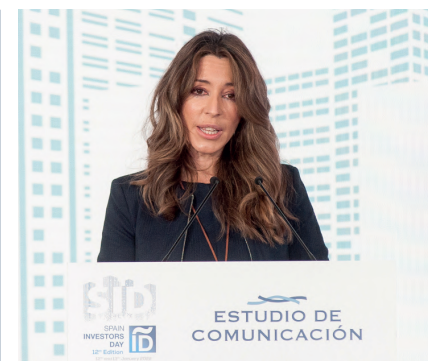
Xiana Margarida Méndez , secretaria de Estado de Comercio y Presidenta del ICEX

España se recupera de manera continuada, con exportaciones récord