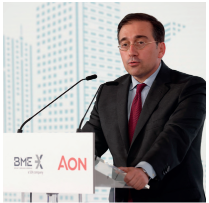
José Manuel Albares , ministro de Asuntos Exteriores, Unión Europea y Cooperación

"Sentamos las bases de un crecimiento sostenible"