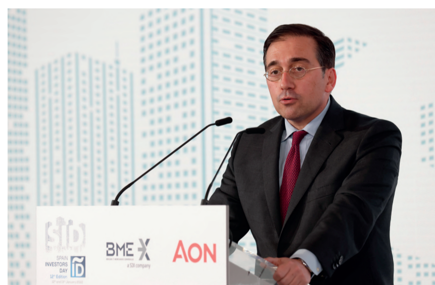
José Manuel Albares transmitió un mensaje de confianza a los inversores internacionales.

énfasis en que “España es el decimocuarto exportador mundial de servicios comerciales y el décimo octavo de mercancías; el peso de las exportacio-