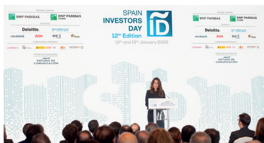
La Secretaria de Estado de Comercio pronunció su discurso antes que el Presidente del Gobierno.