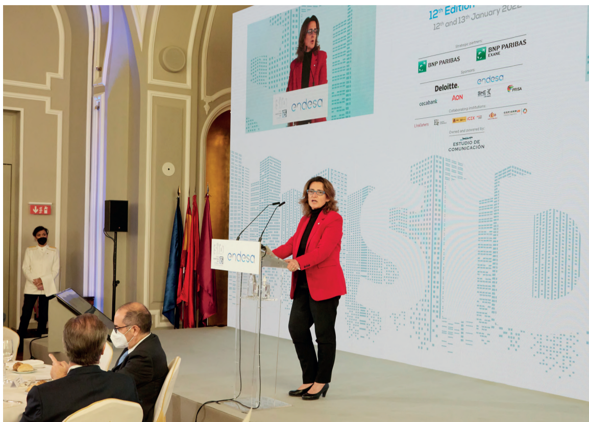
Teresa Ribera se mostró, ante los inversores, firme defensora de la seguridad jurídica y normativa del sector energético.

Se refirió también la ministra Ribera a los efectos de la pandemia por COVID-19 y a los desastres naturales en los altos e inestables precios de la energía: “España ha sufrido la pandemia, como el resto de países, pero todas las instituciones del mundo han intentado evitar cualquier tipo de turbulencia económica y social en la situación económica global”, aseguró la Ministra. “Junto a ello, los desastres meteorológicos o las dificultades sociales, son diferencias sutiles que muestran el desfase entre la coherencia que todos necesitamos reforzar en los distintos niveles de la sociedad, tras el embate de la dramática crisis que hemos vivido durante los últimos dos años, y las preocupaciones sobre la salud”. Al respecto, recordó que esta conclusión ya se encontraba entre las referencias y conclusiones más importantes del último Foro Económico Mundial de Davos. f