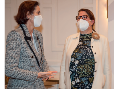
La ministra Reyes Maroto y Cecilia Boned, presidenta de BNP Paribas en España.