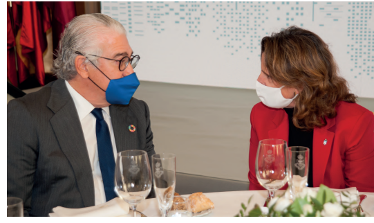
José D. Bogas, CEO de Endesa, habla con Teresa Ribera, vicepresidenta tercera, durante el primer almuerzo coloquio.