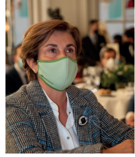
Ángeles Santamaría, CEO de Iberdrola España.