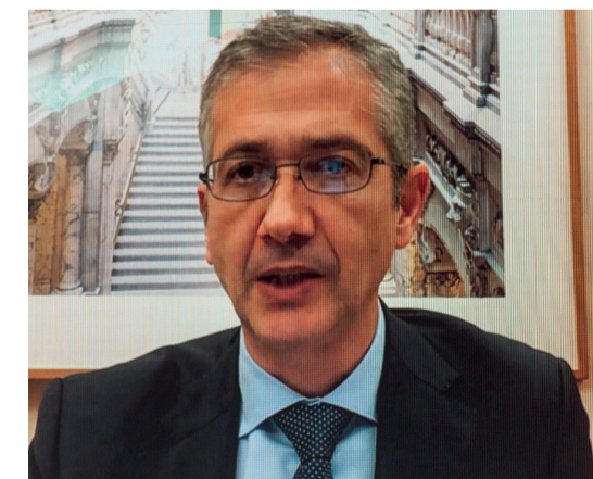
El Gobernador del Banco de España intervino telemáticamente desde su despacho oficial.

Según el Gobernador, “estamos en uno de los momentos de mayor necesidad de reasignación de recursos a las empresas y de realizar importantes reformas estructurales”. En este sentido, destacó que “seguimos manteniendo una importante flexibilidad en la política monetaria y no esperamos subidas de los tipos de interés en 2022”. Además, apuntó que esas reformas deben poner el necesario énfasis en diseñar un plan fiscal adecuado. f