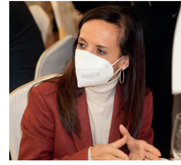
Beatriz Corredor, presidenta de Red Eléctrica.