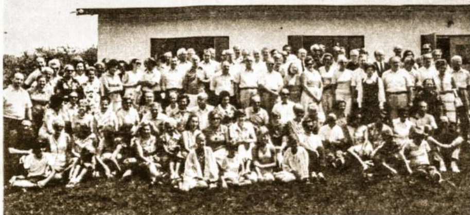
Lietuvių Fronto Bičiulių poilsio ir studijų savaitės, įvykusios 1973 rugpiūčio 5 - 11 Dainavoje (prie Detroito) dalyviai.

Iš LFB JAV-bių ir Kanados studijų savaitės