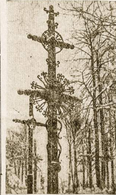
šipuošusiais "Rūpintojėliais", koplytėlėm ir kryžiais.

patyrus. Dėl to ir turime tą pačią "lietuviškąją krikščionybę", kur senosios religijos liekanos maišosi su naująja Kristaus perkeistąja. Kur visa Lietuva tapo nusėta tautine ornamentika iš-