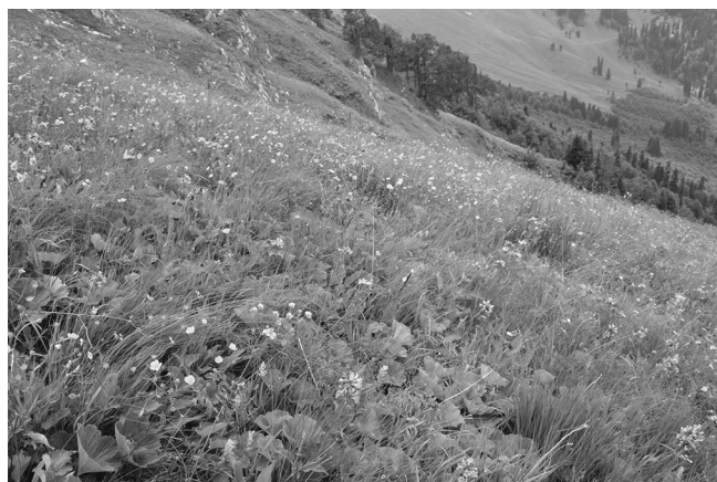
Рис. 3. Сообщество Festuca woronowii – Woronowia speciosa на юго-западном склоне г. Пшегишхва.

Характерной особенностью сообществ является присутствие в травостое некоторых альпийских видов-петрофитов, таких как Androsace villosa ,