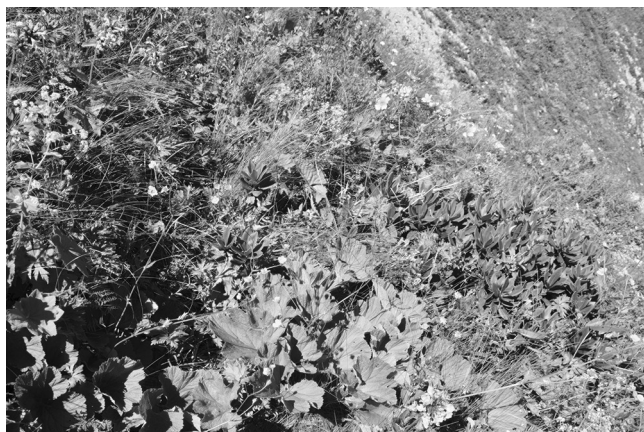
Рис. 5. Сообщество Anemone fasciculata–Woronowia speciosa на северном склоне хр. Аибга.

Ординационный анализ (рис. 6) подтвердил выявленную флористическую дифференциацию сообществ. В пространстве двух первых осей ординации формируются группы описаний, соответствующие выделенным типам сообществ. Также выявлена взаимосвязь осей с некоторыми экологическими факторами. Первая ось связана в первую очередь с изменением высоты над уровнем моря. Коэффициент корреляции между изменением