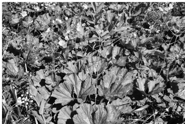
Рис. 1. Вороновия прекрасная Woronowia speciosa (Albov) Juz. Fig. 1. Woronowia speciosa (Albov) Juz.

Вороновия прекрасная Woronowia speciosa (Albov) Juz. (рис. 1) – эндемик Западного Кавказа, включенный в Красную книгу Краснодарского края [1]. Этот вид согласно критериям Международного союза охраны природы и природных ресурсов относится к категории «Уязвимый – Vulnerable». Woronowia speciosa – луговой вид, который встречается в субальпийском высокоотравье, на лугах, полянах в верхнелесном, субальпийском и альпийском поясах. Приурочен к известковым почвам. При доминировании в фитоценозах формиру-