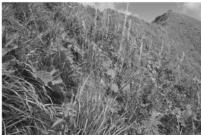
Рис. 4. Сообщество Calamagrostis arundinacea–Woronowia speciosa на южном склоне хр. Амуко.

Как и в сообществе Calamagrostis arundinacea–Woronowia speciosa , с высоким постоянством встречается Calamagrostis arundinacea , однако только на г. Пшегишхва он имеет высокое обилие (3 балла).