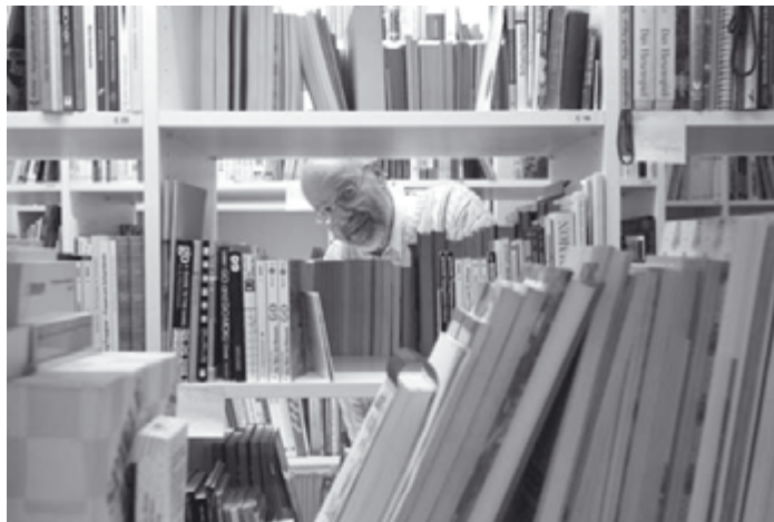
Demnächst dann in Nürnberg? Das Spiele-Archiv wird Marburg verlassen.