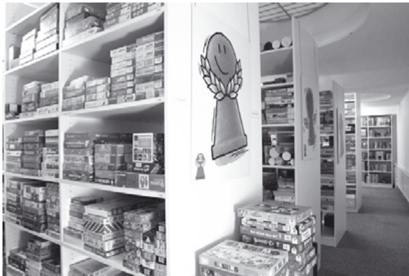
Im Fundus des Spiele-Archivs werden auf einer Fläche von etwa 800 qm über 30.000 Spiele dokumentiert.

Mit dem gleichen interdisziplinären Ansatz entstand 1995 an der Universität Leiden eine internationale Arbeitsgruppe für »Board Games Studies«. Historiker und Archäologen, Ethnologen und Anthropologen, Mathematiker, Ökonomen und Vertreter unterschiedlicher geisteswissenschaftlicher Disziplinen treffen sich alljährlich in einem anderen