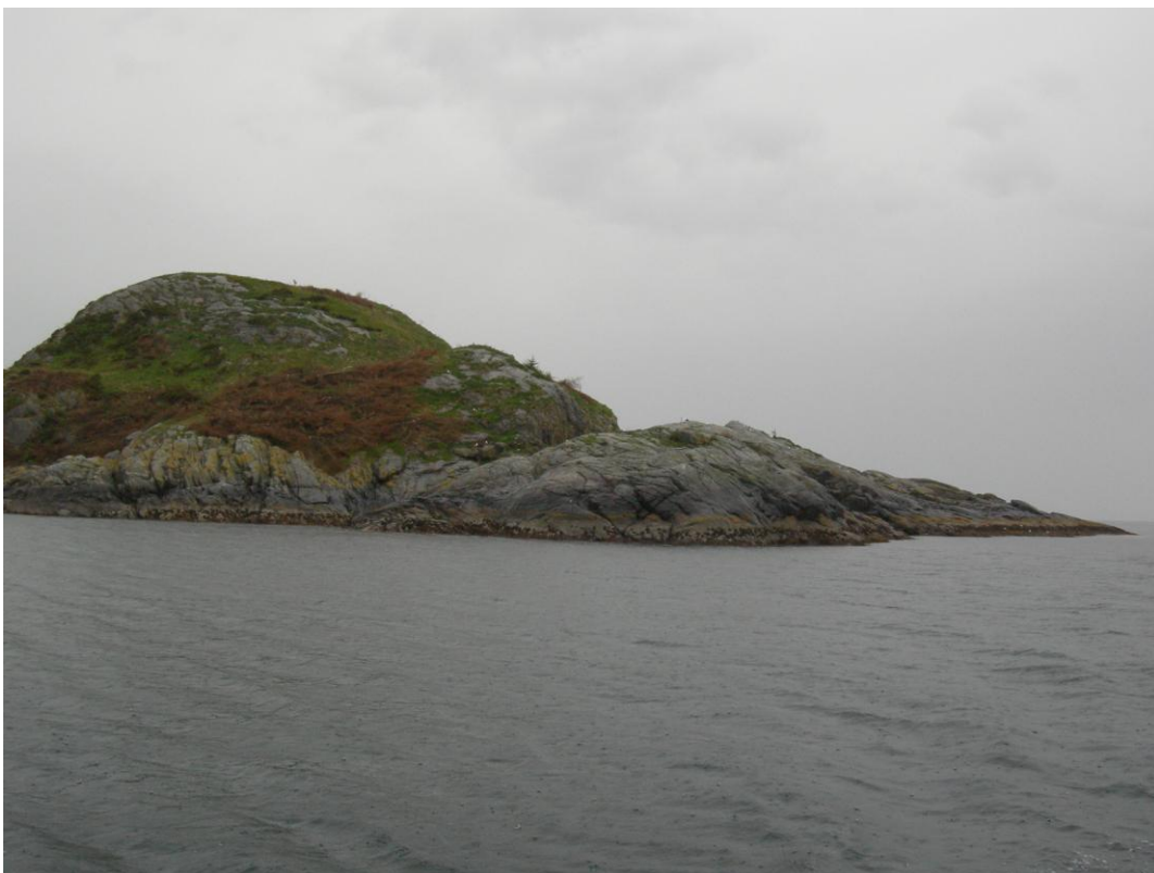
Dei brune felta er hogstavfall etter tre- og krattryddinga vinteren 2008/2009. På grunn av mykje nedbør våren 2009 var det ikkje forhold for brenning.

Sildekruna naturreservat er eit av dei sjøfuglreservata som grør til med kratt og lauvskog. I 1990-åra var det eit aukande problem med attgroing av lauvtre på Sildekruna. Lauvkratt blei rydda i 1999/2000, men på grunn av rotskota frå stubbane og manglande beitedyr grodde området raskt til igjen. Vinteren 2008/2009 vart Sildekruna på nytt rydda, både sitkagran og lauvkratt vart saga ned. Lyngen og hogstavfallet vart ikkje brent, pga. for vått vær på seinvinteren. Hogstavfallet vil bli rydda/brent vinteren 2009/2010. For å sikre opne areal og dermed gunstigare hekkeforhold for sjøfugl i framtida, bør tre, buskar og lyng/kratt på Sildekruna haldast nede.