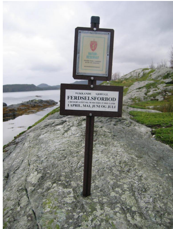
Standart verneskilt i sjøfuglreservata.

Med ein stadig veksande privat småbåtflåte på kysten og i fjordane, er det viktig å informere sjøfarande om vernet og om ferdselsforbodet i hekketida. Vi ser det også som eit mål å informere om fuglelivet og naturkvalitetane i sjøfuglreservata. Fylkesmannen vil utarbeide informasjonsplakatar om naturreservatet med m.a. kart, foto og vernereglar, til å henge opp på plassar der båtfolk ferdast (t.d. hamna på Silda).