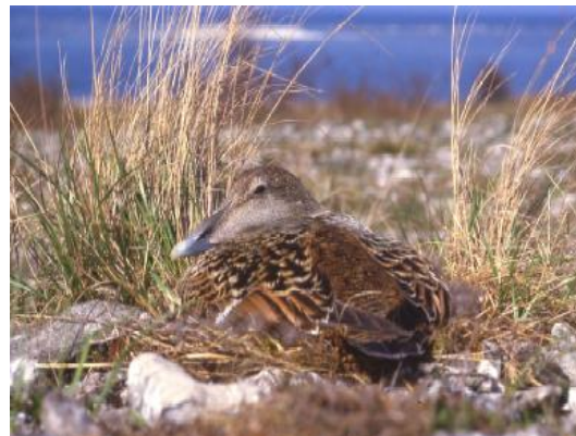
Ærfugl hekkar også i naturreservatet.