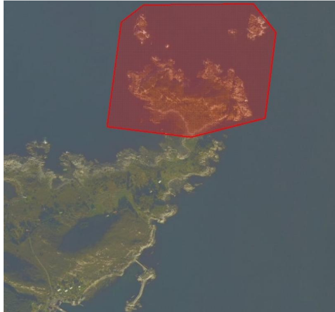
Flyfoto av Sildekruna som ligg nord på øya Silda. (henta frå www.norgebilder.no ). Grensene for naturreservatet er merkte med raudt.

Reservatet dekkjer eit areal på om lag 254 dekar, av dette er om lag 72 dekar landareal. Sildekruna er ein holme/halvøy nord på øya Silda i Vågsøy kommune. Naturreservatet omfattar også Sildeskjeret og Sildeholmen som ligg nord for Sildekruna. Silda og Sildekruna ligg mellom Nordvågsøy i vest og øya Barmen i aust, inne i Sildegapet. Sørsida av Sildekruna har langgrunne strender, og ved fjøre sjø er holmen landfast med Silda. Det går ein åsrygg på langs av øya, frå aust til vest. Høgste punktet strekkjer seg 38 meter over havet. Det har vore eit problem med attgroing med lauvkratt på Sildekruna. Tidleg i 2009 vart Sildekruna rydda for både lauvkratt og sitkagran. På grunn av mykje nedbør let det seg ikkje gjere å brenne hogstavfallet før hekketida tok til.