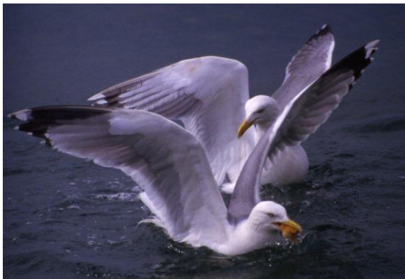
Sildekruna naturreservat er eit viktig hekkeområde for gråmåse.

Sildekruna vart rydda for krattskog vinteren 1999/2000. Det var stor grad av spiring ut frå røtene (rotskot) og sørsida av Sildekruna var grott til att med krattskog før området vart rydda igjen i januar/februar 2009, berre 9-10 år etter siste rydding. Første sesongen etter ryddinga i 1999 var talet på gråmåse og svartbak på eit normalt høgt nivå sett i forhold til andre måsekoloniar i fylket på den tida. Tilgroinga utover på 2000-talet kan ha vore medverkande årsak til nedgangen i hekkebestandane for måse. Større delar av Sildekruna naturreservat vil etter skjøtselen i 2009 på ny vere meir tilgjengeleg og eigna for hekking. Det er likevel næringstilgangen i havet som for tida vert vurdert som den viktigaste avgrensande faktoren for sjøfuglane sin hekkesuksess, både i Sogn og Fjordane og elles rundt Nordsjøen.