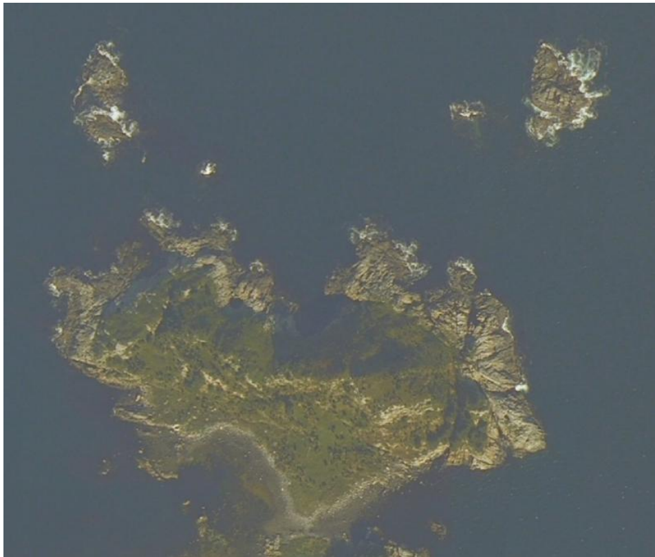
Flyfoto av Sildekruna