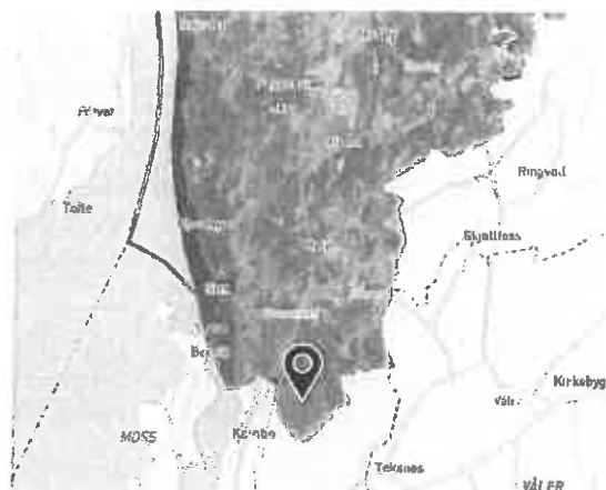
Kartutsnitt som viser plassering av Ødemørk.

Området er et mye brukt natur-, rekreasjons- og friluftsområde både sommer og vinter. Ødemørkstua har åpen kafe på søndager og det er tilrettelagt med merkede stier og gangveier. Mye av skogen er eldre og kun påvirket av noe plukkhogst. Spredt finnes verdifulle innslag av middelaldrende og eldre osp og som har begynt å danne en del død ved. De høyproduktive delene av området representerer en skogtype som er sjelden i Norge pga. storstilt oppdyrking av denne typen arealer.