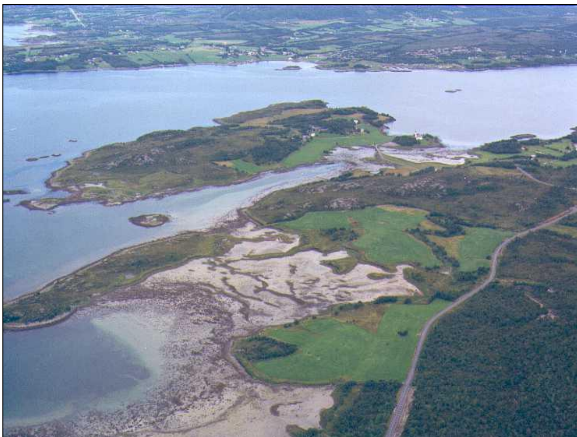
Fig 2. Store delar av sundet og bukta fell tørt ved fjære sjø, her sett frå sør-vest.