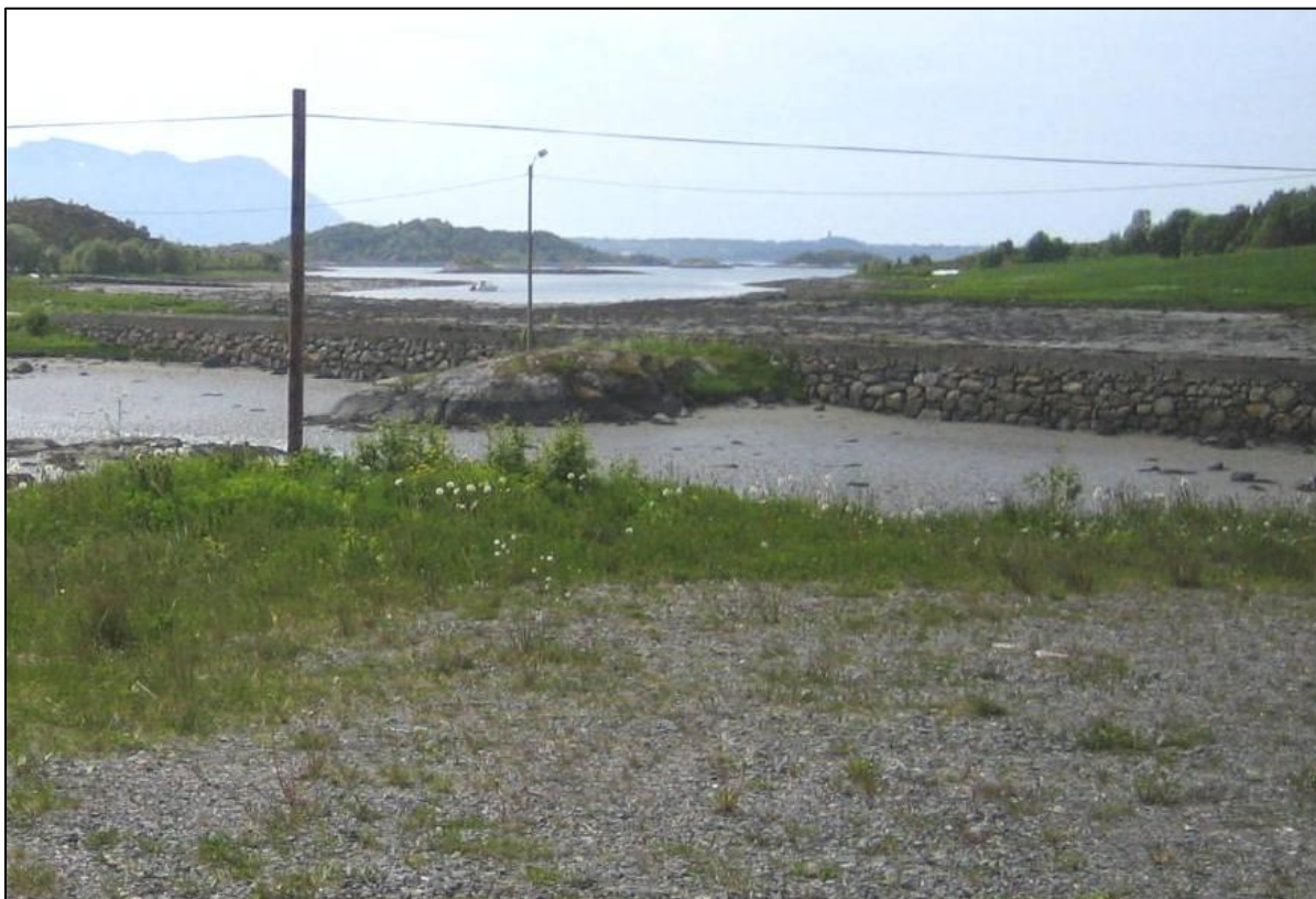
Fig. 6. Valen er delt av vegen til Vågøya, med fylling, fast dekke, gatelys og telefonline.

Det er fylt ut ein vor på ca. 50 meter ut i Valen på sørsida, og her ligg det ute ei flytebrygge med båt.