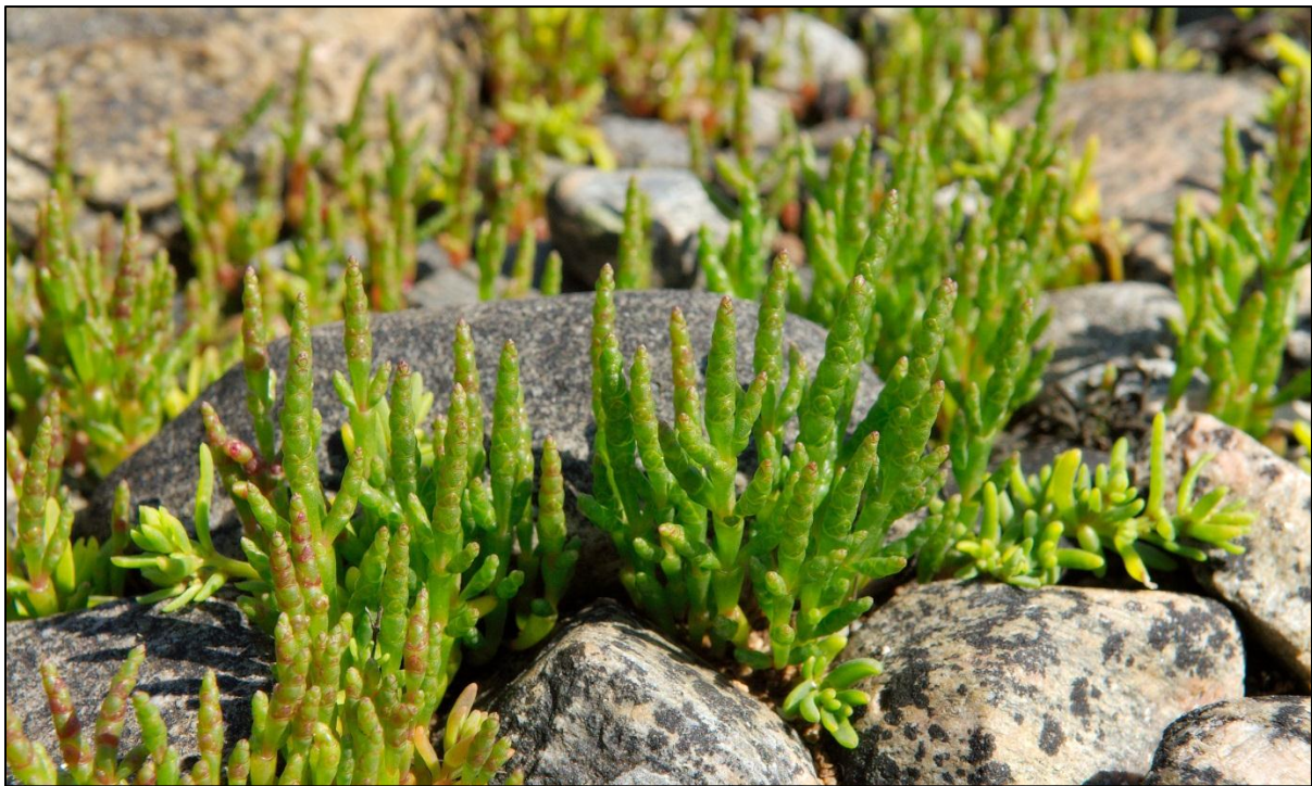
Fig 3: Salturt har fleire førekomstar i reservatet

Fræna kommune kartla naturtypene i kommunen i 2004 (Jordal 2005). Avgrensa lokalitetar blei sorterte og verdsette etter naturtype på ein skala frå A – C (A=svært viktig, B=viktig, C=lokalt viktig), der Langøyvågen blei klassifisert som Havstrand/kyst med verdi A.