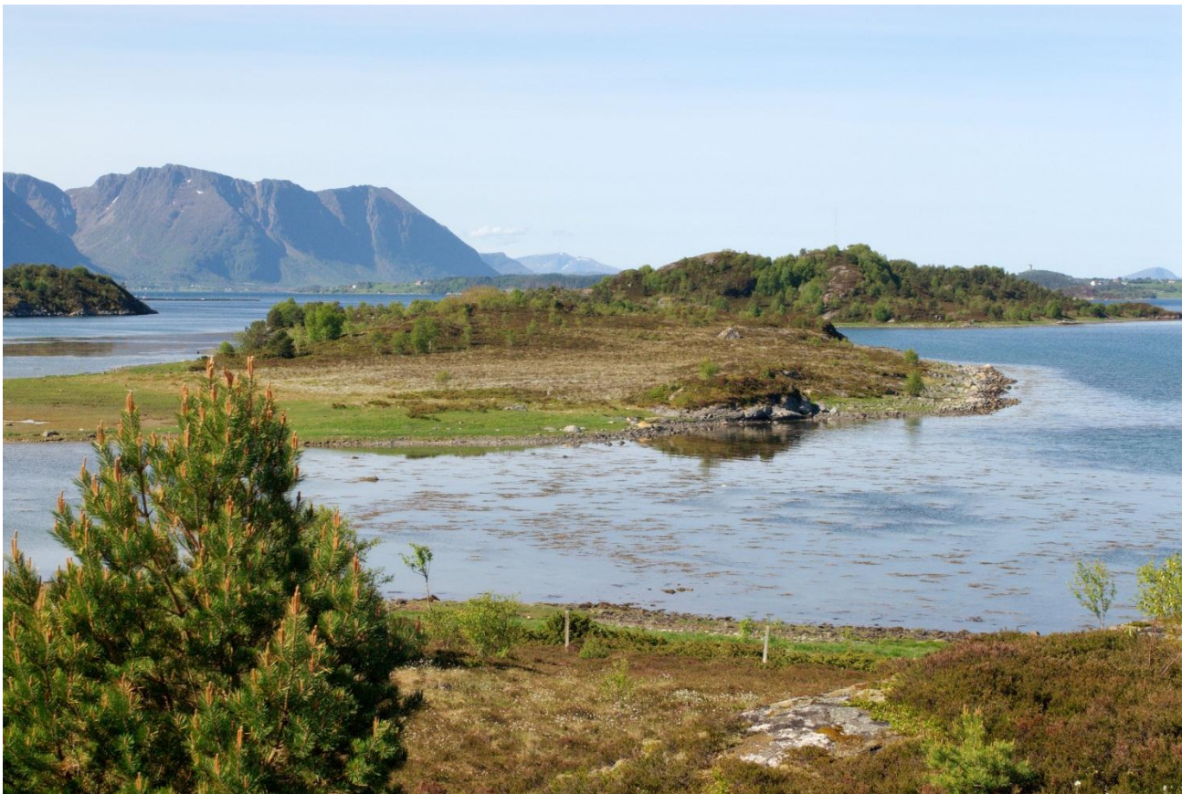
Fig. 8. Mot Langøya

Forvaltingsplanen for Langøyvågen naturreservat gjeld fram til ny forvaltingsplan er vedtatt. Fylkesmannen er ansvarleg for revideringa av planen. Ein tek sikte på å gjere dette ca. kvart 10. år, første gong ca. 2020. Fylkesmannen kan revidere planen på eit tidligare tidspunkt om det er nødvendig. Bevaringsmåla vil bli reviderte i samsvar med nasjonale standardar når desse føreligg, uavhengig av rulleringa av forvaltingsplanen.