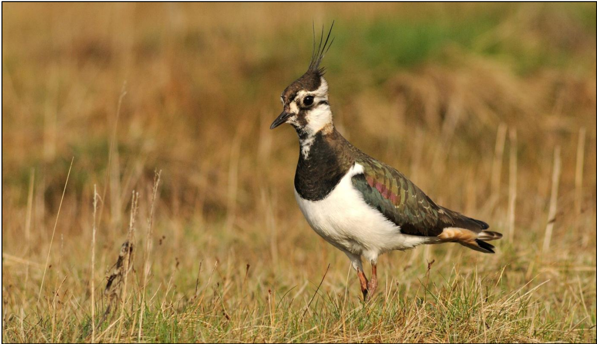
Fig. 4. Vipa kan framleis observerast på strandengene i Langøyvågen

med stor botanisk variasjon, der strandengene mest består av undervassenger, salt- og brakkvassenger. Dei store førekomstane av salturt gjer at området også er ein spesiallokalitet for denne strandtypen.»