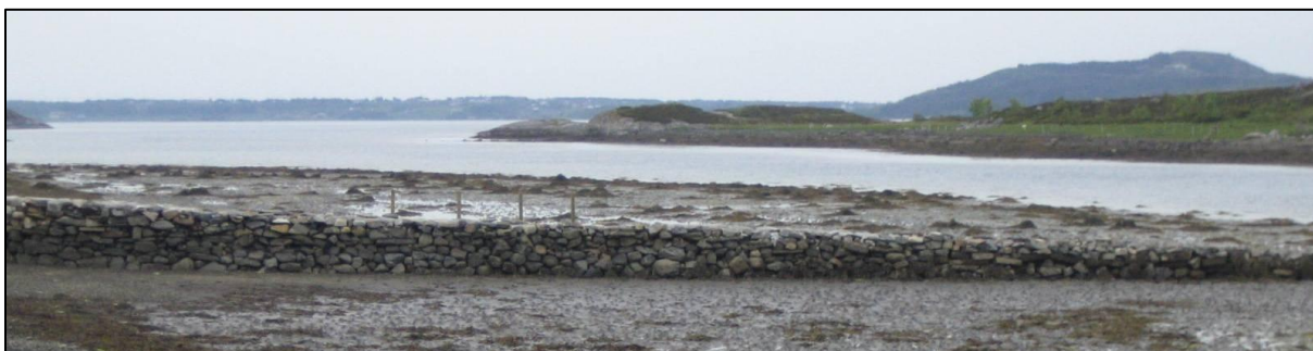
Fig. 7. Det er ein molo i vestre del av Valen