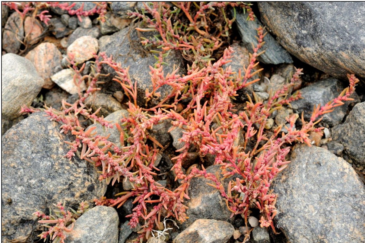
Fig. 3. Saftmelde finst på ein lokalitet på Langøya

Naturreservatet er artsrikt med ca. 70 registrerte planteartar. Interessante artar er småhavgras, ishavsstorr og dei store bestandane av salturt. Det veks svartor i stranda (Jordal 2005). Her er påvist ein lokalitet med saftmelde (Asbjørn Børset, pers. oppl.)