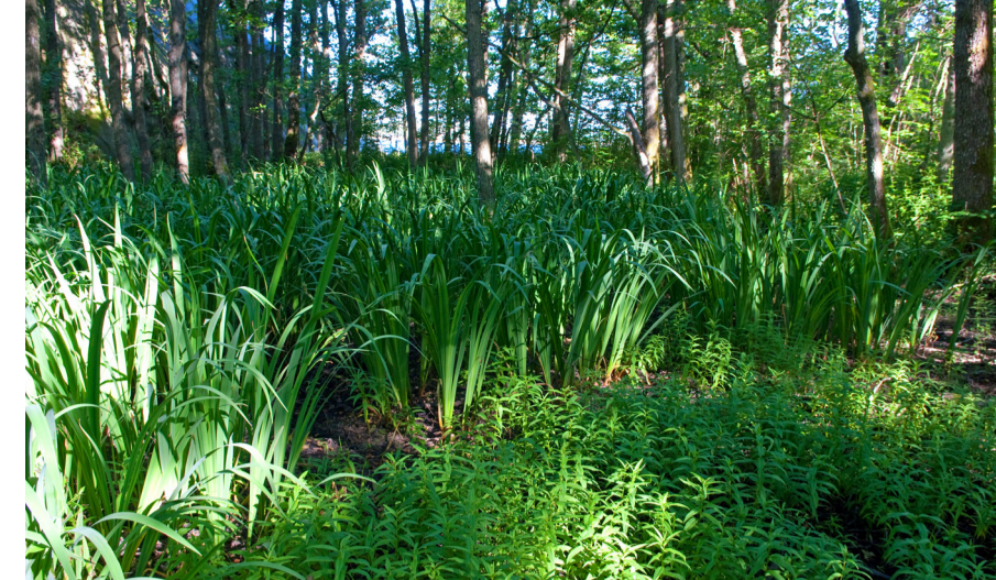
I sumpskogen nede ved sjøen finner man mye svartor og sverdlilje.