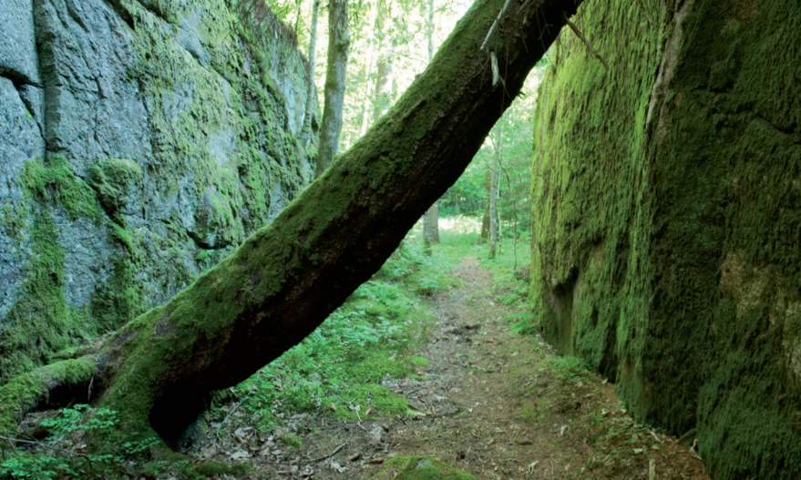
Rød-Dirhue har en rekke dype glover.