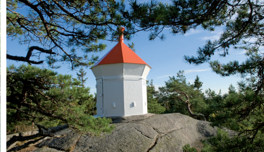
Oppe på de avskrapte knausene er den artsfattige kystfuruskogen.