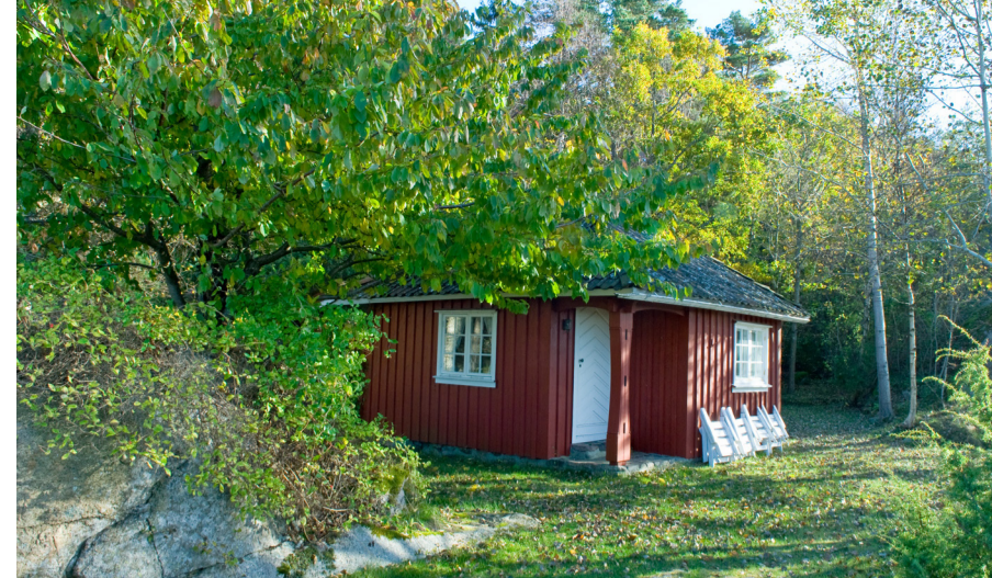
Berstad var Alf Larsens lille dikterstue.