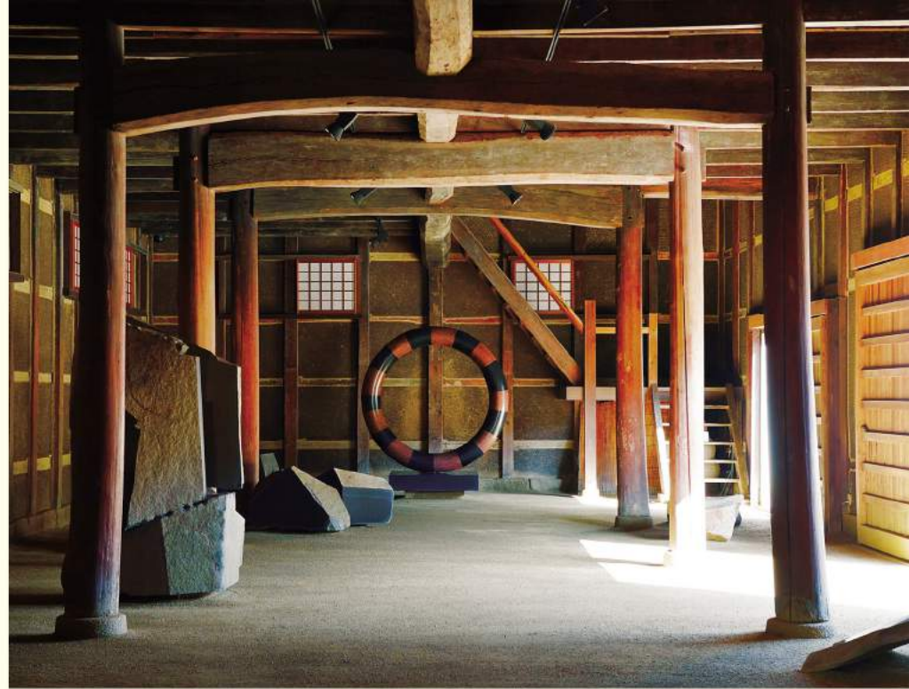
古い酒蔵を移築して設けた展示蔵。時間、空間、質感の対比が味わい深い。