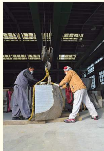
危険を伴うため緊張感溢れる石材加工の作業現場。

牟礼の石工文化がイサム・ノグチの芸術を支えたと同時に、イサム・ノグチの存在もまた、従来の伝統にとらわれぬ新しい芸術の息吹を牟礼にもたら