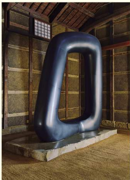
大作「エナジー・ヴォイド」の圧倒的な存在感。台座には打ち水が施されていた。