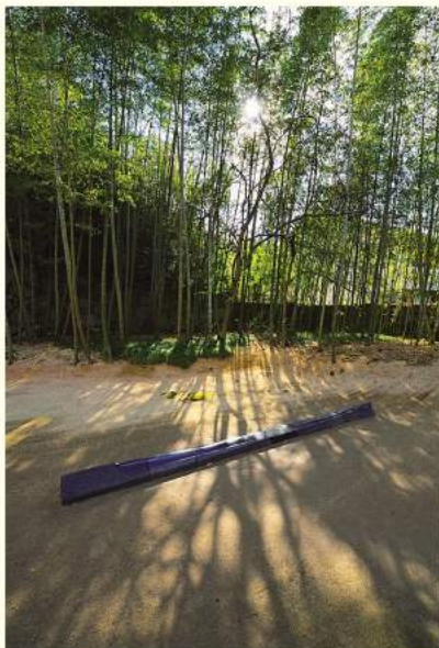
木漏れ日の中、庭先に置かれた作品が表情を刻々と変化させる。

香川県高松市、日本三大石材産地のひとつとして有名な牟礼は、高級石材の庵治石の産地として古くから栄えた。眼前に屋