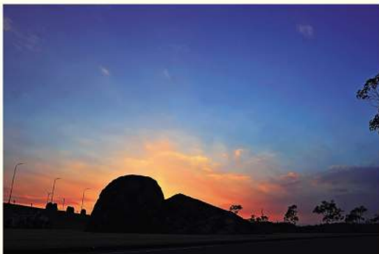
高松空港に設置されたノグチの遺作「TIME AND SPACE」