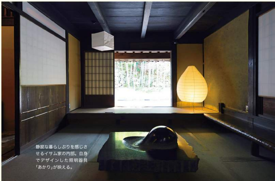
静かな暮らしぶりを感じさせるイサム家の内部。自身でデザインした照明器具「あかり」が映える。

配置された一五〇点の彫刻作品には、タイトルやデータを記したプレートなどついていない。解説や年譜といったものも見当たらない。