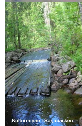
Kulturminne i Sörjabäcken