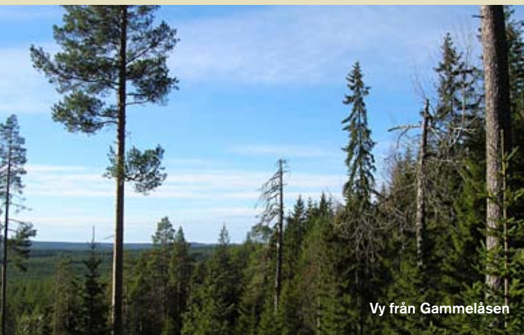
Vy från Gammelåsen

Människor har präglat Ovansjös skogar under lång tid och här finns spår av både järnbruk, fäboddrift och gammal folktro.