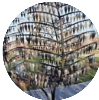
Askgravlunden vid Kalmar kyrka är populär.