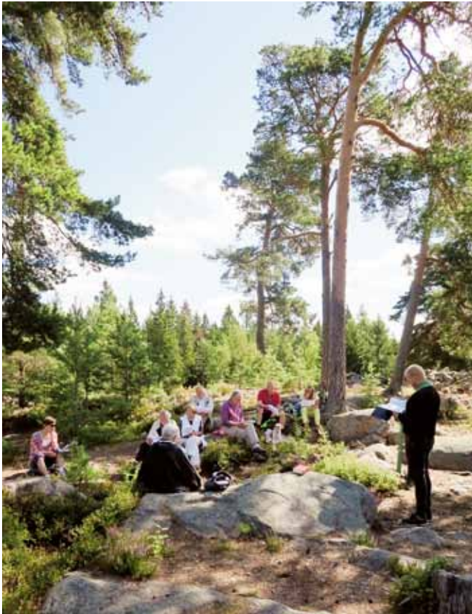
Friluftsgudstjänst vid Salsta fornborg.