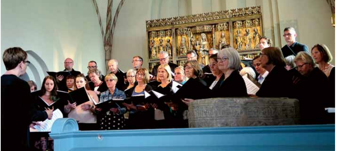
Svensk-norsk i kören.