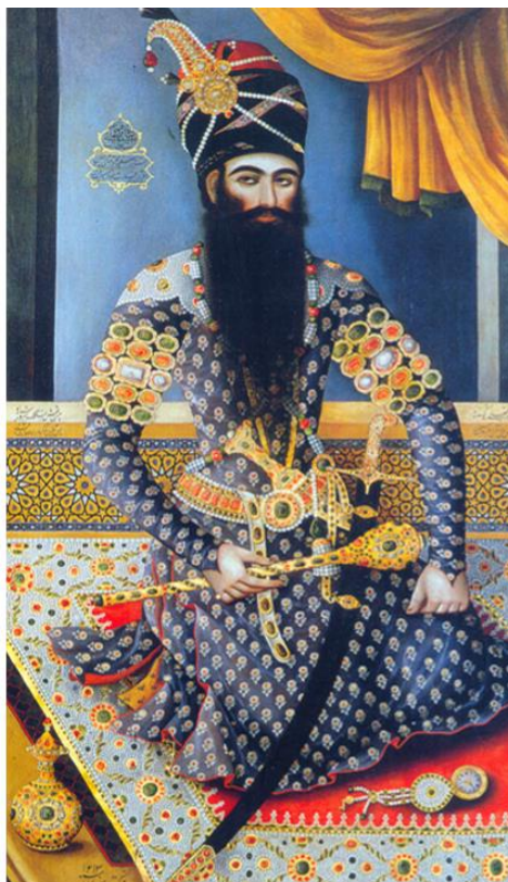
تصویر ۶: فتحعلیشاه نشسته، میرزا بابا، رنگ و روغن روی بوم، تهران، ۱۳۰۳ ه. ق. ماخذ: (اردکانی، ۱۳۹۲: ۲۵۹).

همان گونه که در پیکرنگاری درباری، پیری و کهولت سن وجود ندارد. همچون فتحعلی شاه که همه جا جوان و رعنا به نظر می رسد (تصویر ۷). اگر به هنرهای تصویری از گذشته تاریخ تاکنون نگاهی بیندازیم مشخص خواهد شد که سر یا چهره آدمی جایگاهی متفاوت از سایر اجزا پیکره انسانی داشته است. این مهم در تمامی هنرهای تصویری جهان قابل رؤیت بوده و آثار به جا مانده نیز شاهد این مدعا است. بدین جهت باید گفت که این مؤلفه جزئی از تاریخ هنر و فرهنگ بشر است و صرفاً به ادبیات و هنر ایرانی اختصاص ندارد، بلکه هنر ایران نیز که در تداوم سنت تاریخ شکل گرفته، از آن بهره برده و با تعاریف و ویژگی های فرهنگی خود آن را شرح و بسط داده است (اردکانی، ۱۳۹۲: ۱۴۶). رؤیت حالات عاطفی و نمایش تغییرات روح و روانی در آثار علیقلی خوئی بی شباهت به آثار پیکرنگاری درباری نیست. در نقاشی دیدار یوسف و زنان درباری، انگشت حیرت و حالت تعجب را بازنمایی کرده است (تصویر ۷).