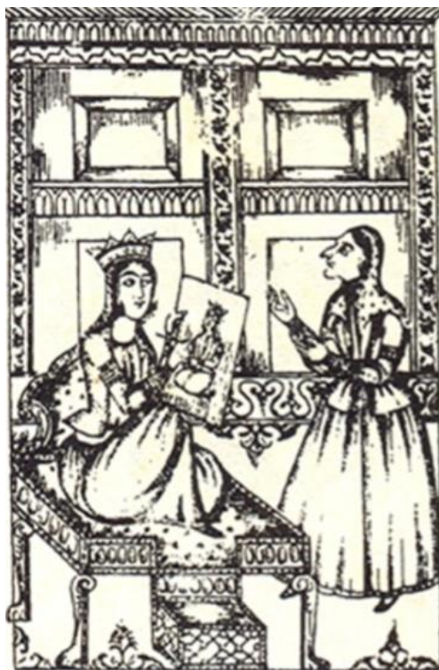
تصویر 4: الف لیله و لیله، میرزا علیقلی خوئی، تهران ۱۲۷۵ ه.ق. مأخذ: (مارزلف، ۱۳۹۰: ۱۵۹).

مشهود است. پیکرنگاری درباری نیز اهدافی چون وقار و جلال و زیبایی را با تقارن نمایش داده است. آثار میرزا علیقلی خوئی مطالعه خوبی از سبک معماری و پوشاک و مکتب‌خانه‌ها و معماری فضای شهری، تزیینات داخلی بناها همچون نقاشی دیواری، آرایه ستون‌بندی‌ها و پنجره‌های ارسی است. پوشاک نیز شامل لباس‌های پر زرق و برق قاجاری همانند مخمل، ترمه و زربافت و همچنین خویی به نقوش فرش و زیراندازها هم دقت کرده است. در تصاویر هزار و یک شب، هنرمند از اصول تقارن جهت نمایش شکوه درباری و نظم طبقه حاکم استفاده کرده است. علی‌رغم پیچیدگی‌های خاص ادبی در سبک و صناعات متن هزار و یک شب، علیقلی خوئی توانسته زبان خاص هنری متناسب برای جلوه گونی به اثر ببخشد. نکته دیگر در آثار علیقلی خوئی توجه او به حالات انسانی چه در چهره‌ها و چه در حرکات دانست. اشخاص زیبارو به منظور تاکید بر جمال رخسار و زیبایی تمثیلی به صورت سهرخ ترسیم شده‌اند (تصویر 4).