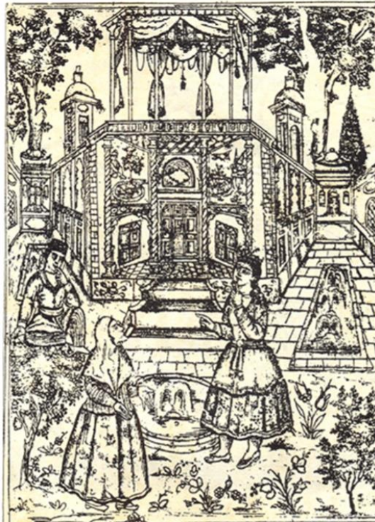
تصویر ۵: الف لیله و لیله، میرزا علیقلی خوئی، تهران، ۱۲۷۵ ه. ق. (ماخذ: مارزلف، ۱۳۹۰: ۱۴۰).

پیرزنان را به شکل عجوزگان، گویی زنان پیر به علت عدم زیبایی رخسار جایگاهی در جهان بینی او نداشته‌اند (تصویر ۵).