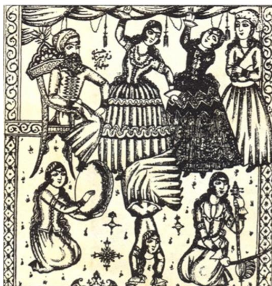
تصویر ۳: الف لیله و لیله، میرزا علیقلی خوئی، تهران ۱۲۷۵ ه.ق. (ماخذ: مارزلف، ۱۳۹۰: ۱۶۸).

میرزا علیقلی خوئی در نگاره‌های هزار و یک شب با الگوبرداری از این نوع صحنه‌آرایی بسیاری از صفحات را آراسته است (تصویر ۳).