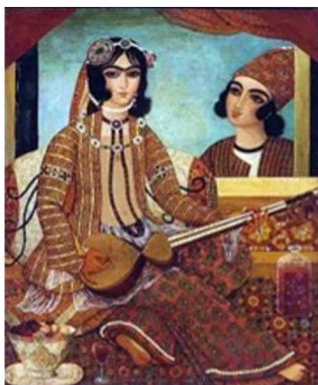
تصویر ۹: هنرمند نامعلوم، رنگ و روغن روی بوم، قرن ۱۳ه. ق.

به نظر می‌رسد او علاقه‌ای به نمایش فرهنگ بیگانه یا عناصر وارداتی در هنر خود نداشته است. شاهزاده خانم در مرکز تصویر نشسته و ساز می‌نوازد و فرش گسترده در اتاق مملو از نقش‌مایه‌های ریزنقش است، چنین می‌نماید که نقش‌مایه‌های ریز و ظریف به موازات به کمال رساندن حال و هوای تصویر و ایجاد هماهنگی بین عناصر بوده است و هنرمند با الگوبرداری از اسلوب‌های پیکرنگاری درباری، مجلس‌آرایی را به کمال رسانده است (تصویر ۹).