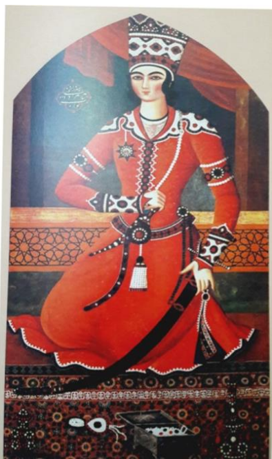
تصویر ۲: شاهزاده مبرزای یحیی، محمد حسن نقاش، رنگ و روغن روی بوم، ۱۲۶۴ ه.ق.

میرزا علیقلی خوئی در نگاره‌های هزار و یک شب با الگوبرداری از این نوع صحنه‌آرایی بسیاری از صفحات را آراسته است (تصویر ۳).