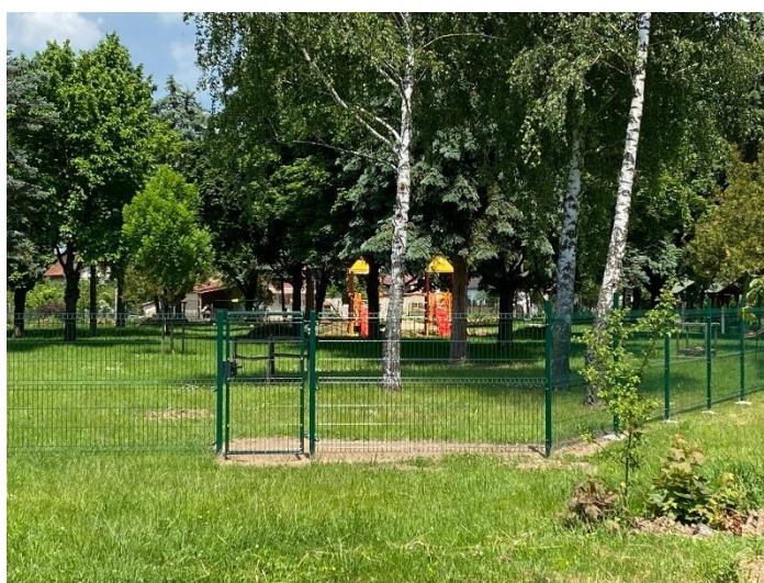
Előtte-utána képek a felújításban lévő játszóteréről