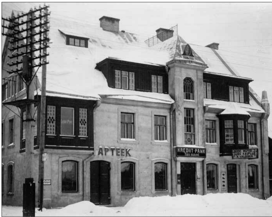
Johan Pari apteek 1932. a Pikal tänaval.

II maailmasõja ajal sai kesklinn kõvasti kannatada, apteek kolis korduvalt ja tegutses väga viletsates oludes. Apteegist oli mõnikord saada vaid hügieenitooteid – seebi ja pesupulbrit. Sõja ajal müüdi apteegis ka