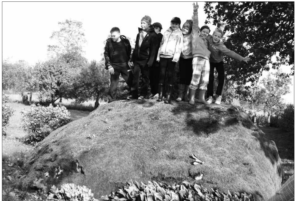
Majandusõppe õpilased külastamas Tapa valla looduskunneid kohti.