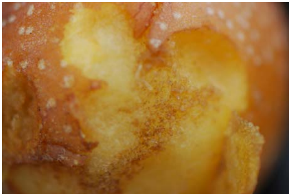
果實蠅為害橫山梨

本旬報每月發行3次，提供農政單位、試驗機構及產銷班掌握害蟲資訊，若需索取書面原始密度資料請另洽。為方便相關單位掌握此項訊息，另建置專屬網頁，供各界下載瀏覽，網址為 http://www.tari.gov.tw/form/ ，每旬更新一次。