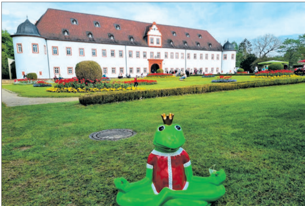
Vor und hinter den Schlossmauern spielt sich das Genuss- und Gartenfest in Heusenstamm mit 120 Ausstellern und Streetfoot-Corner ab.