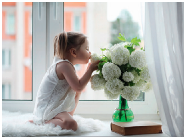
Ohne Kälte und Zugluft wird der Fensterplatz ruck, zuck zum neuen Wohlfühlort.