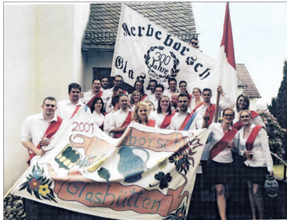
Eine stolze Zahl von 24 Kerborschen und -mädeln war beim Jubiläum 2017 dabei, unterstützt durch einige Altkerborsch. Jetzt will man in Glashütten an die große Kerbtradition anknüpfen.