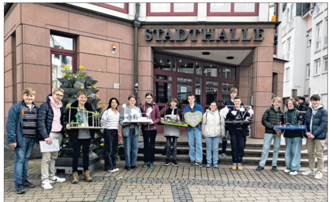
Die an der Landespreisverleihung teilnehmenden BNS-Schüler mit ihren Modellen. Die Erbauer von „Heavens Fire“ (8., 10. und 11. von links) erreichten den dritten Platz.