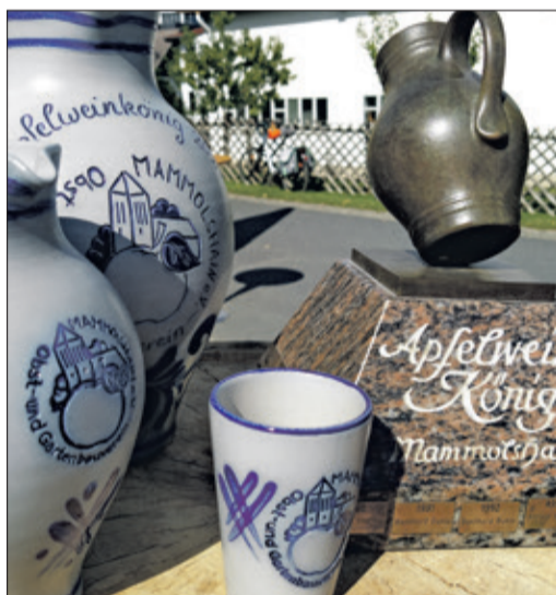
Wer hat das beste „Stöffsche“?

Pro Person kann eine Probe abgegeben werden. Voraussetzung ist, dass die Äpfel aus dem Taunus stammen und es sich um eine private, nicht-kommerzielle Herstellung handelt. Die Bekanntgabe der Gewinner findet zeitnah auf dem Mammolshainer Apfelblütenfest am 1. Mai statt.