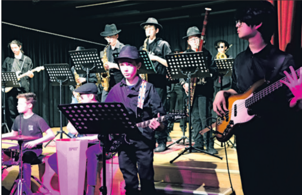
Die TGK-Bigband führte mit mitreißenden Stücken zum Abendprogramm hin.