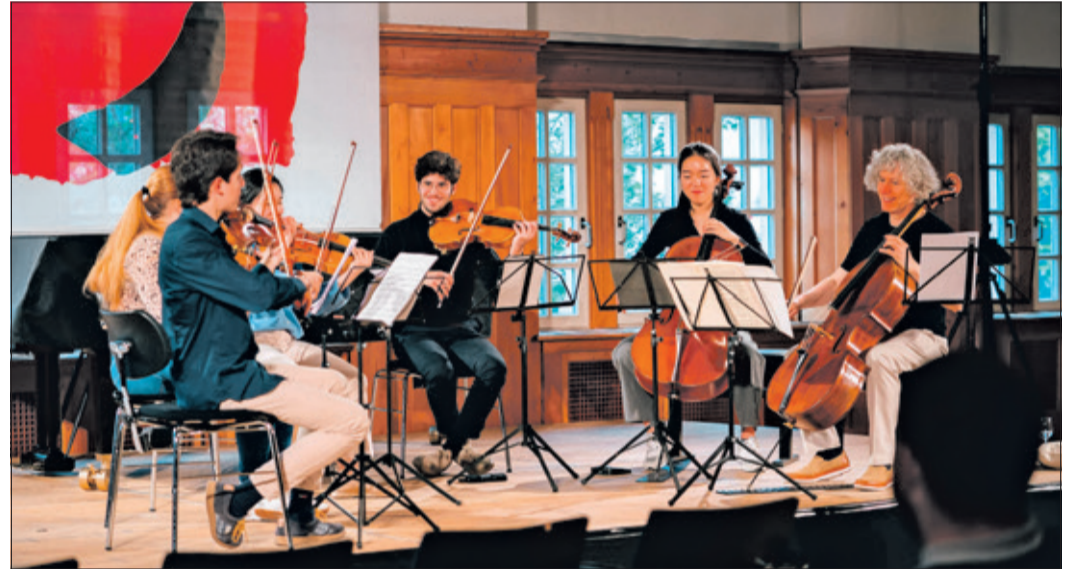
Chamber Music Connects the World 2022