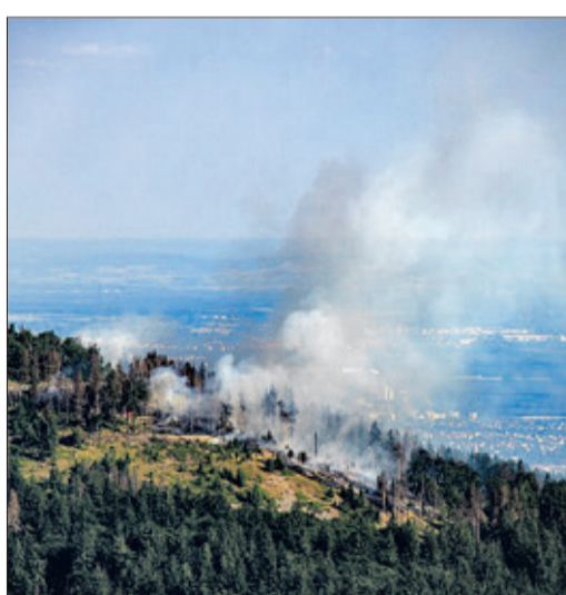
Waldbrand am Altkönig im Jahr 2023

Antworten hierauf will der Fachkongress „Waldbrände – Eine Gefahr für die Zukunft unserer Wälder!“ liefern, der am Samstag, 20. April, von 14 Uhr bis circa 17 Uhr in der Stadthalle Kronberg am Berliner Platz stattfindet. Hierzu lädt die Schutzgemeinschaft Deutscher Wald – Ortsverband Kronberg im Landesverband Hessen ein, die in diesem