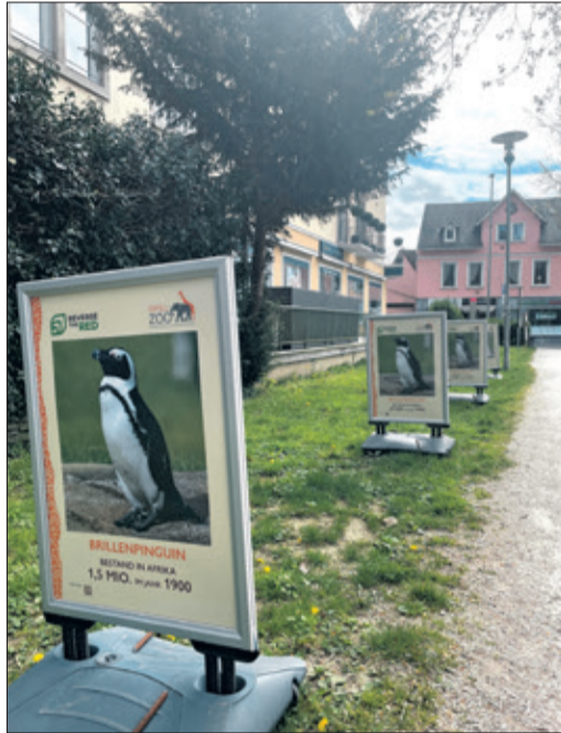
Vom Aussterben bedroht: der Brillenpinguin. Den Rückgang der Population kann man auf der Bilderreihe in der Konrad-Adenauer-Anlage nachvollziehen.

Seit dem Bau der Pinguinanlage 2016 ist der Opel-Zoo Teilnehmer am Erhaltungszuchtprogramm für Brillenpinguine (Europäisches Ex-situ Programm, EEP). Seither gab es über 30 erfolgreiche Nachzuchten, von denen