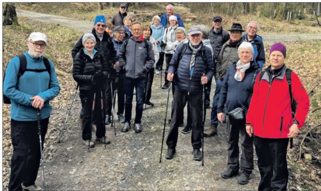
Die Wandergruppe des Förderkreises der Städtepartnerschaft auf den Spuren von Philipp Reis.