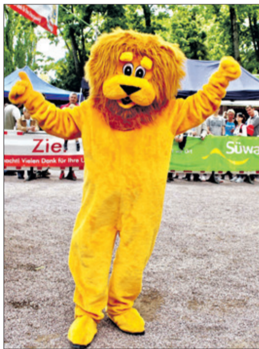
Auch Leo freut sich schon auf einen „löwenstarken“ Lauftag.

Königstein Burg. Das ist keine Selbstverständlichkeit. Der bekannte HK-Kreisstadtlaufer, vergleichbar von der Teilnehmerzahl, aber mit ausgedehnter Laufstrecke von Hofheim nach Höchst, wird am Himmelfahrt nach 25 Jahren zum letzten Mal stattfinden. Gründe seien laut Veranstalter zu wenig ehrenamtliche Helfer und die umfangreichen Auflagen. In Königstein ist das ein perfektes, gut organisiertes Zusammenspiel. Die Mitarbeiter des Bauhofs helfen gerne auch mal an einem Sonntag. Und viele Sponsoren haben mittler-