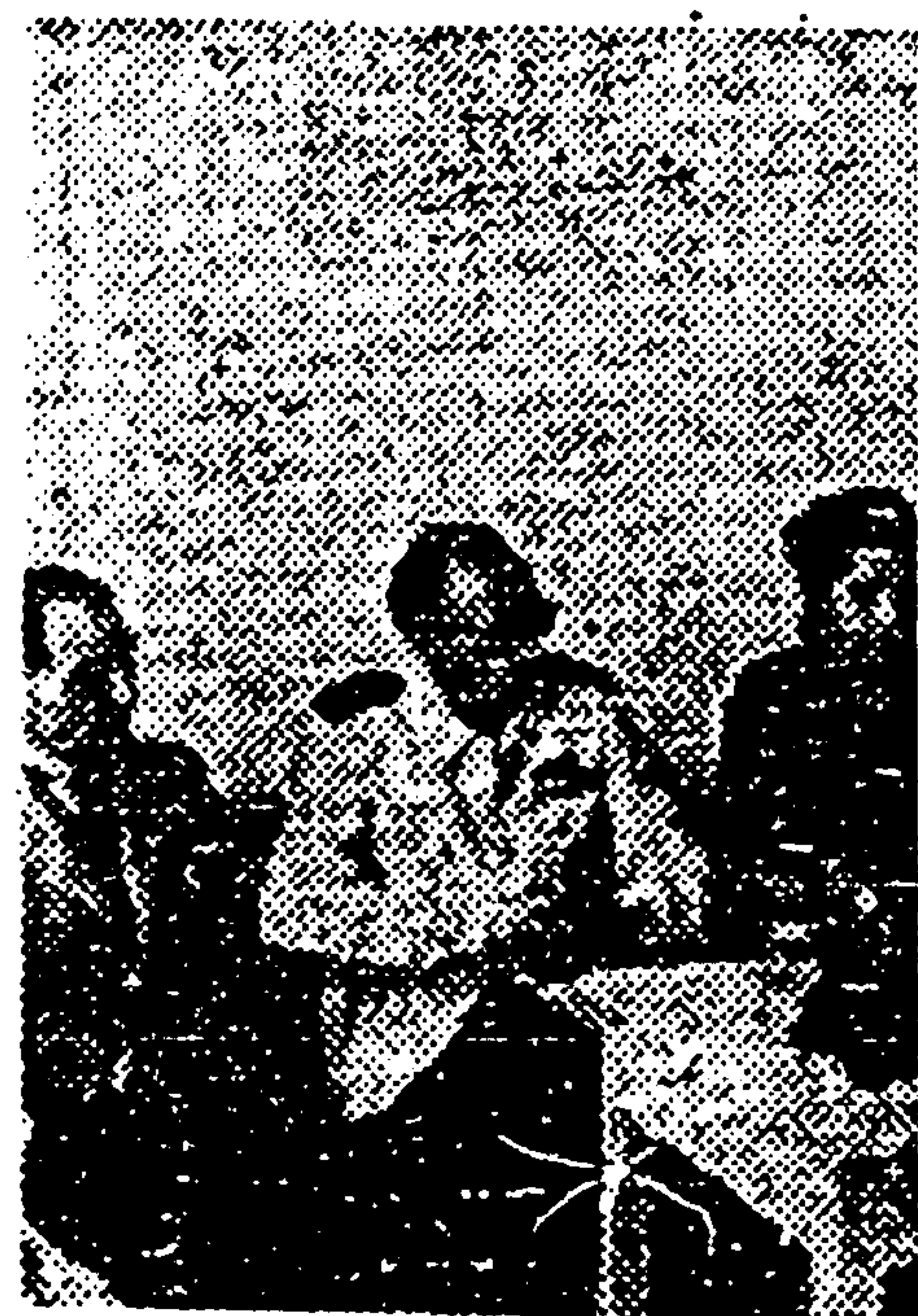
Presidente del acto de clausura de las Visitadoras de