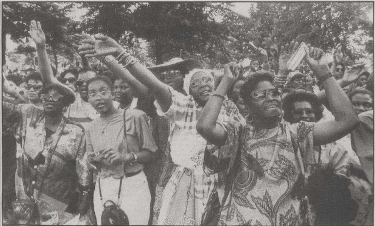
Surinamers vierden gisteren de afschaffing van de slavernij, 130 jaar geleden.