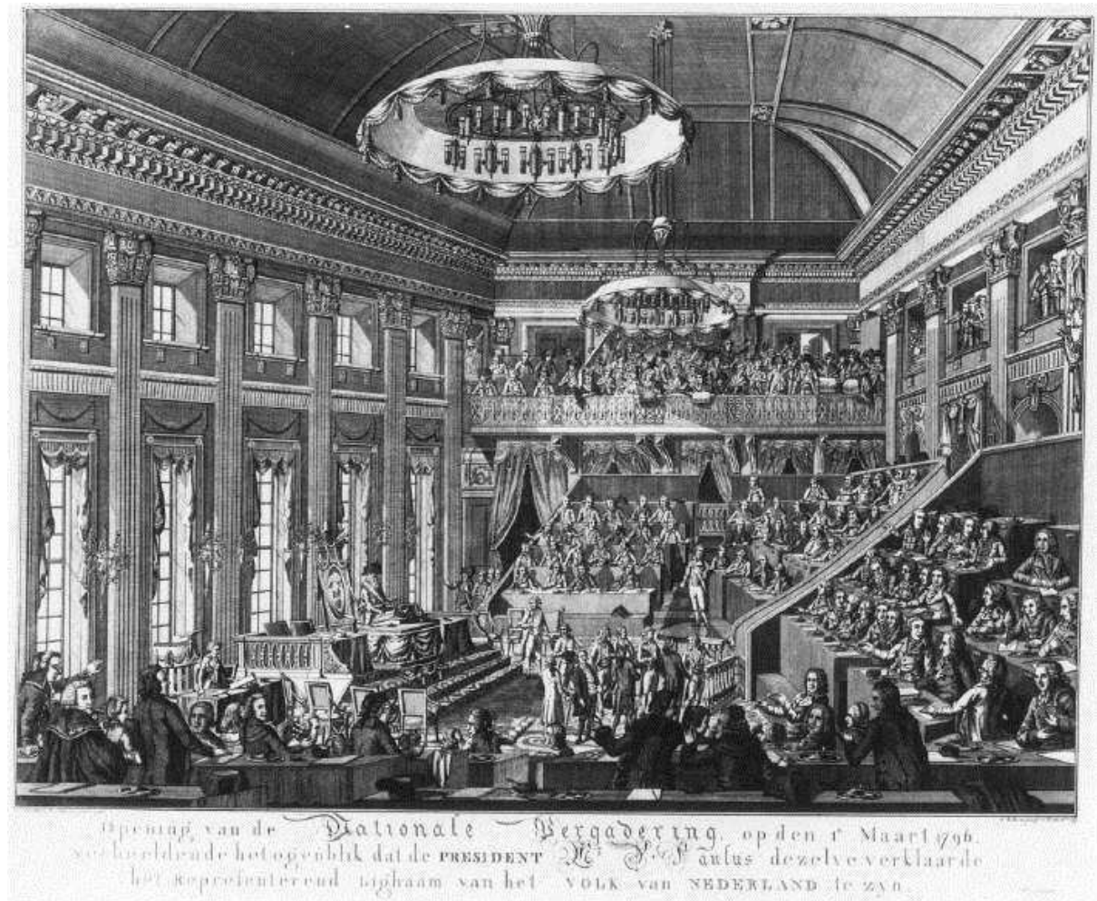
De eerste Nationale Vergadering, 1796.