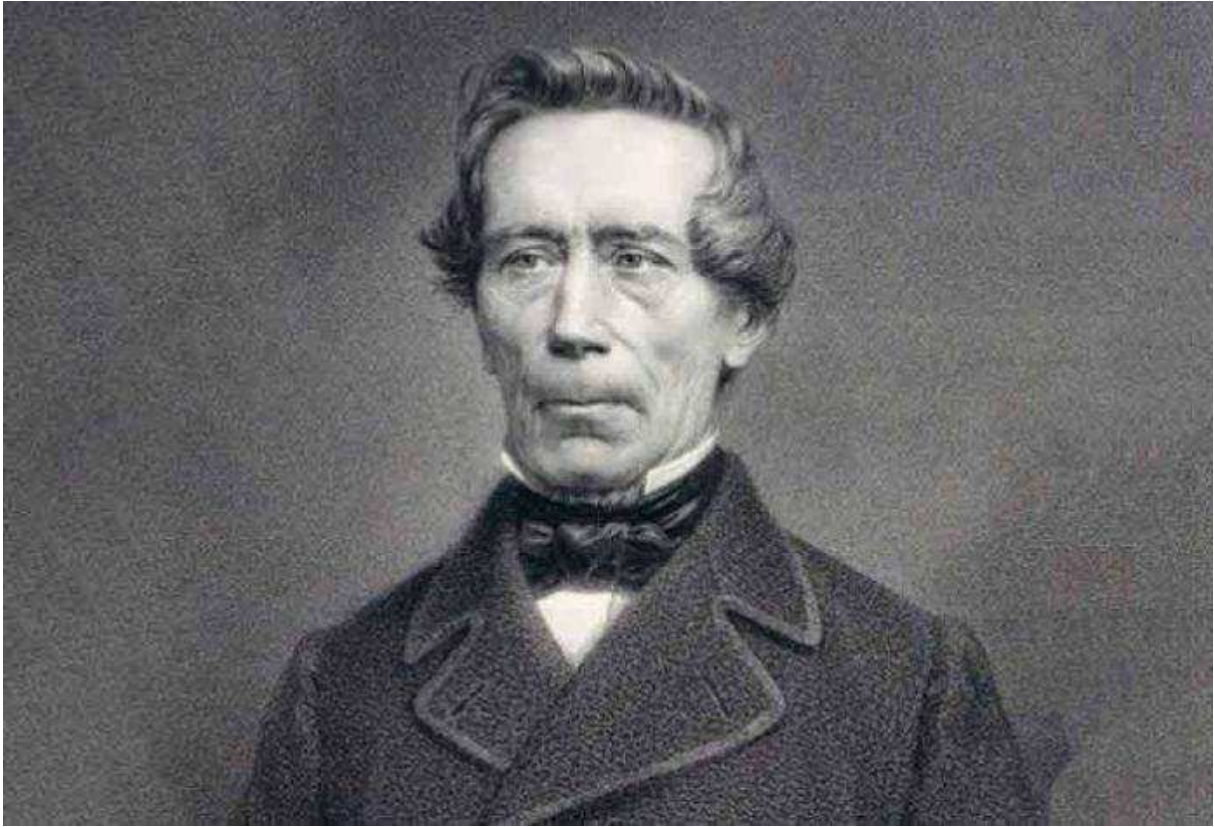
Johan Rudolph Thorbecke (1798-1872).

Maar voordat de afschaffing van de slavernij een feit was, moest het parlementaire debat erover nog plaats vinden. Dat debat komt in hoofdstuk 4 uitgebreid aan de orde.