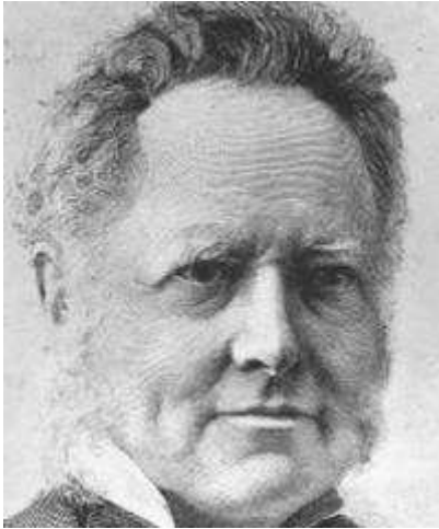
Jan Heemskerk Azn. (1818-1897).