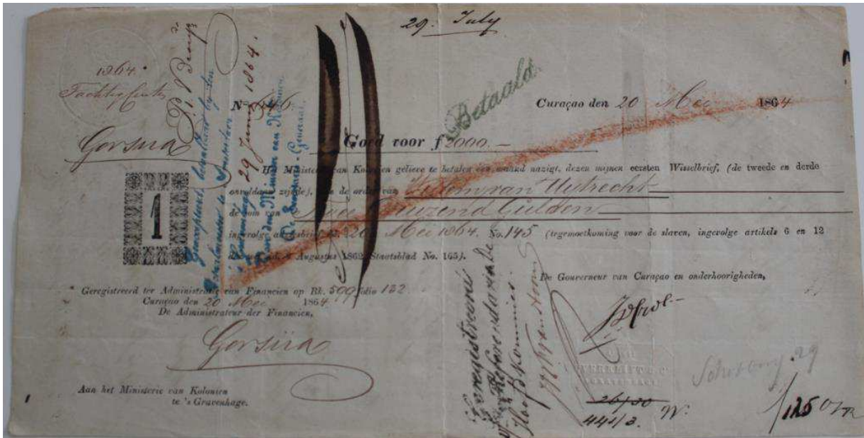
Wisselbrief Curaçao, 1864.