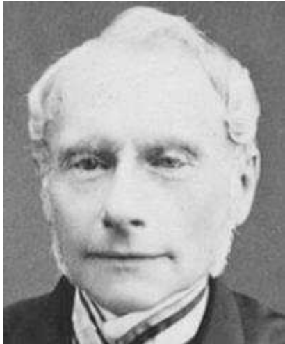
Pieter Jacob Elout van Soeterwoude (1805-1893).

Het eenige voordeel, dat deze erlangt —en ik dank den Minister daarvoor — is, dat geene zweepslagen meer tot straf zullen worden opgelegd voor het niet volbrengen zijner taak. Maar wie beoordeelt dat niet volbrengen? Wie waakt met goed gevolg tegen inhaligheid en hardheid der meesters? Zie, Mijnheer de Voorzitter, dat is eene andere gewichtige vraag. De wet zelve geeft het niet genoegzaam aan. Zullen algemeene verordeningen genoegzaam waken, daarvoor zorgen, en beslissen?"