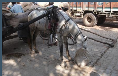
Animal sin arnés o sin carga.