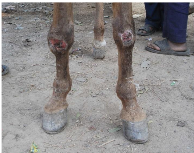
Lesiones en las rodillas que indican una caída.