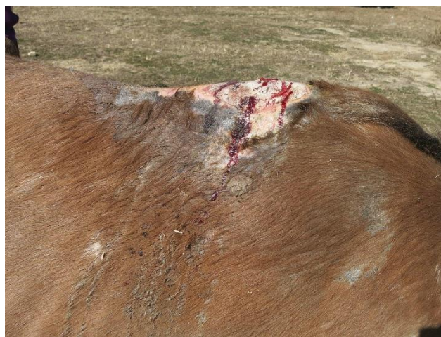
Lesiones del cuerpo en la cruz/columna vertebral.