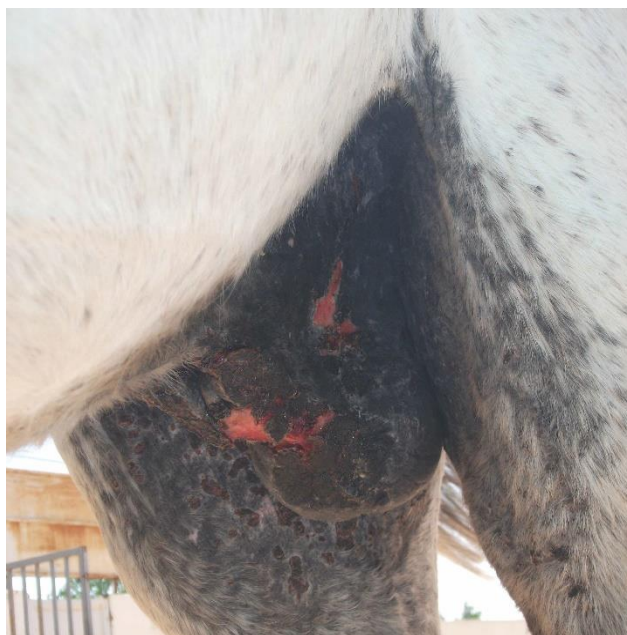
Lesión por latigazos en los genitales.