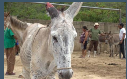
Lesión en el oído por pelea con otros burros.