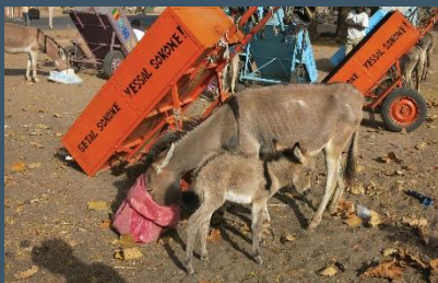
Animal sin arnés en su descanso.

Consulte el Manual de Veterinaria de equinos de trabajo, los planes o estrategias de trabajo de compromiso con la comunidad y las directrices antes de realizar una intervención.