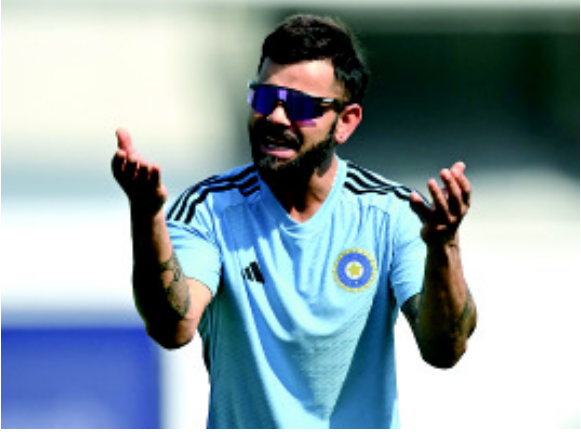
ସେ ପ୍ରତି ଦିନିକିଆ ୬ ଲକ୍ଷ, ଟେଷ୍ଟରୁ ୧୫ ଲକ୍ଷ ଓ ଟି-୨୦ରୁ ୨୦ ଲକ୍ଷ ଟଙ୍କା ପାଉଛନ୍ତି । ଇଣ୍ଡିଆନ୍ ପ୍ରିମିୟର ଲିଗ୍ (ଆଇପିଏଲ୍)ରୁ ସେ ବାର୍ଷିକ ୧୫ କୋଟି ଆୟ କରୁଛନ୍ତି । ବିରାଟ ୧୮ଟି ବ୍ରାଣ୍ଡ ସହିତ ଚୁକ୍ତିବଦ୍ଧ ହୋଇଥିବା ବେଳେ ବିଜ୍ଞାପନ ଶ୍ରେଣୀ ବାବଦକୁ ସେ ବର୍ଷକୁ ୭-୧୦ କୋଟି ଆୟ କରୁଛନ୍ତି । ଏକଲି ବିଭିନ୍ନ ବ୍ରାଣ୍ଡର ପ୍ରଚାର ପ୍ରସାରରୁ ସେ ୧୭୫ କୋଟି ଟଙ୍କା ପାଉଛନ୍ତି । ସୋସିଆଲ ମିଡ଼ିଆ ଇନଷ୍ଟାଗ୍ରାମରେ ପ୍ରତି ପୋଷ୍ଟରୁ ସେ ୮.୯ କୋଟି ଓ ହିଟ୍‌ରେ ପ୍ରତି ପୋଷ୍ଟରୁ ୨.୫ କୋଟି ପାଉଛନ୍ତି । ବିରାଟଙ୍କର ମୁ୍ୟାଲରେ ୩୪ କୋଟି ଓ ଗୁରୁଗ୍ରାମରେ ୮୦ କୋଟିର ଦୁଇଟି ବିକାସପୂର୍ଣ୍ଣ ଅଫିସ୍‌ନା ରହିଛି । ବିରାଟଙ୍କ ପାଖରେ ଅନେକ ଦାନୀ କାର ରହିଛି । ବିରାଟ କ୍ରିକେଟ୍ ପଡ଼ିଆରେ ଦଳକୁ ବିଜୟ କରିବା ପାଇଁ ସେପରି ସଫର୍ଯ୍ୟ କରି ଅନୁପ୍ରାଣ ଦାଉ ବ୍ୟକ୍ତିଗତ ଜୀବନରେ ସେ ସମ୍ପୂର୍ଣ୍ଣ ଜୀବନଶୈଳୀକୁ ପସନ୍ଦ କରିଛନ୍ତି ।

ନୂଆଦିଲ୍ଲୀ (ଏକେନା): ବିରାଟ କୋହଲି ଏହି ଦୁଇଟି ଶବ୍ଦ ହିଁ ସାରା ବିଶ୍ଵର କ୍ରୀଡ଼ାପ୍ରେମୀଙ୍କ ପାଇଁ ଯଥେଷ୍ଟ । ବର୍ତ୍ତମାନ ସମୟରେ ୩୪ ବର୍ଷୀୟ ବିରାଟ ବିଶ୍ଵର ଜଣେ ଅନ୍ୟତମ ଶ୍ରେଷ୍ଠ ବ୍ୟାଟ୍ସମ୍ୟାନ୍ । ଦିନିକିଆ, ଟେଷ୍ଟ ଓ ଟି-୨୦ରେ ବିରାଟ ବହୁ କାର୍ଯ୍ୟାଳୀନ ସ୍ଥାପନ କରିଛନ୍ତି । ଆଜିର ସମୟର କ୍ରୀଡ଼ାବିତକ ମଧ୍ୟରେ କେବଳ ବିରାଟ ହିଁ ସର୍ବନିମ୍ନ ଟେକ୍ସ୍‌ତକରଙ୍କ ୧୦୦-୧୦୦ ରେକର୍ଡ଼ ଭାଙ୍ଗିପାରିବେ ବୋଲି କ୍ରୀଡ଼ାପ୍ରେମୀ ଆଶା କରୁଛନ୍ତି । ଅନେକ ସମୟରେ ପଡ଼ିଆରେ ଓ ପଡ଼ିଆ ବାହାରର ଲାଇଫ୍ ଷ୍ଟାଇଲକୁ ନେଇ ବିରାଟ ଚର୍ଚ୍ଚାରେ ରହିଥାନ୍ତି । ତେବେ ଏହା ମଧ୍ୟରେ ବିରାଟକୁ ନେଇ ଆସିଛି ଏକ ବଡ଼ ଖବର । ବିରାଟଙ୍କର ମୋଟ୍ ସମ୍ପତ୍ତି ୧୦୦୦ କୋଟି ଅତିକ୍ରମ କରିଥିବା ଏକ ରିପୋର୍ଟରୁ ଜଣାପଡ଼ିଛି । ଇନଷ୍ଟାଗ୍ରାମରେ ବିରାଟଙ୍କର ୨୫୨ ମିଲିୟନ ଫୋଲୋଅର୍ସ ରହିବା ସହିତ ତାଙ୍କର ମୋଟ୍ ସମ୍ପତ୍ତି ୧୦୫୦ କୋଟିରେ ପହଞ୍ଚି ଯାଇଛି । ଟିମ୍ ଇଣ୍ଡିଆର 'ଏ' କ୍ୟାଟେଗୋରୀ ଖେଳାଳି ହିସାବରେ ସେ ୬ କୋଟି ପାଉଛନ୍ତି । ଏଥିସହିତ