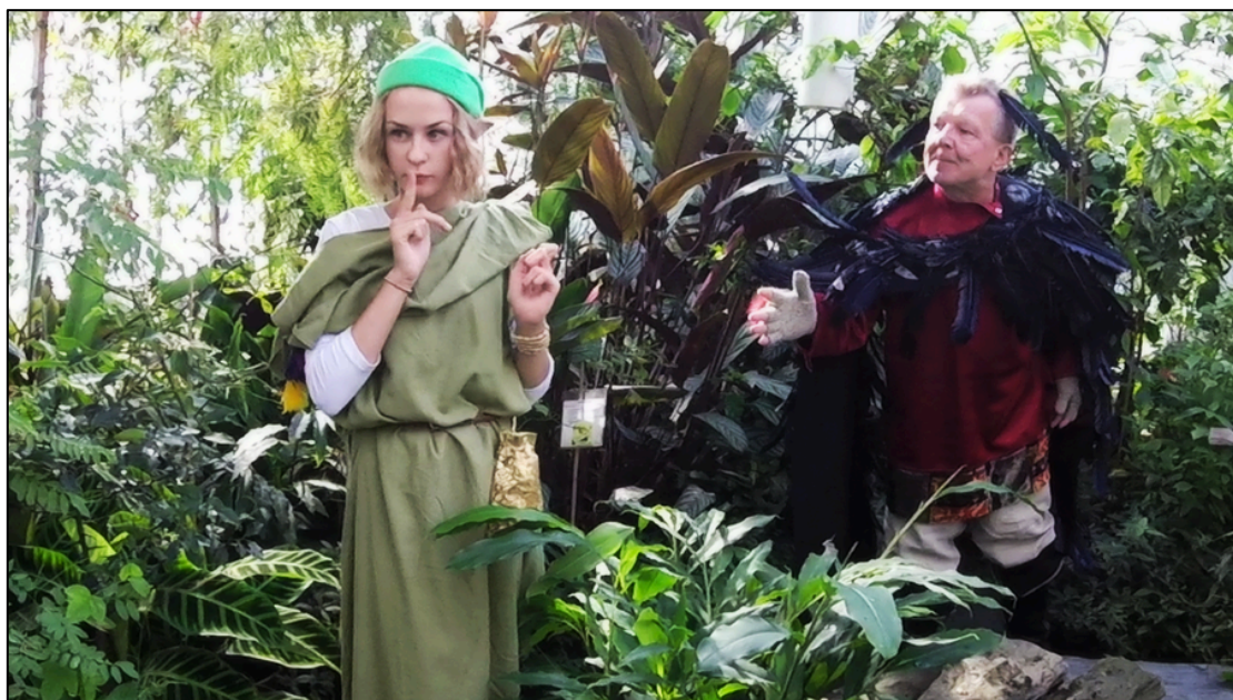
Kuva 2. Rusina ja Vihtahousu Botanian 30-vuotisjuhlan esityksessä

syntyivät hyväntahtoinen kasvien haltia Rusina sekä ilkkurinen hiisi Vihtahousu. Rusinan tapauksessa keskeisimmiksi ominaispiirteiksi määrittyivät kohteliaisuus ja vilpitön innokkuus. Painopiste hahmon olemuksessa oli pääasiallisesti positiivinen. Vihtahousu taas edusti vastavoimaa, jonka tarkoituksena oli toimia tarinan kannalta pienimuotoista kaaosta synnyttävänä osatekijänä. Hahmojen välistä vastakkainasettelua ilmenettiin tarinassa myös rooliasuvalintojen kautta. Kuva 2 havainnollistaa hahmojen ulkomuotojen välistä eroavaisuutta.