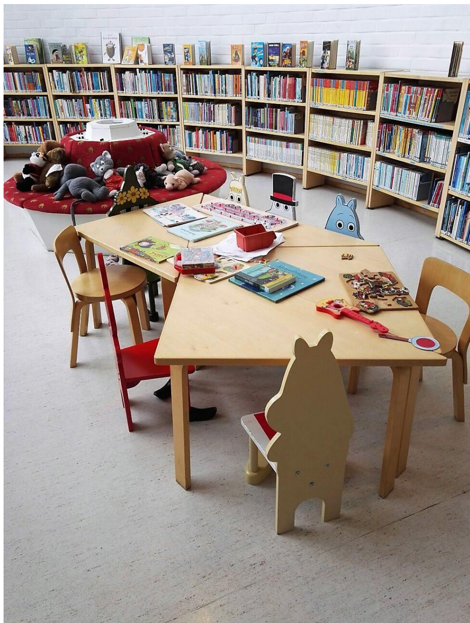
Kuva 2. Kauhavan pääkirjaston lastenosasto.

Kauhavan kaupunginkirjastossa järjestetään esikoululaisille vuosittain kirjastovierailuja Kirjastoleikin nimellä. Kirjastoleikissä tutustutaan kirjastoon ja kirjoihin sekä puhutaan saduista. Lastenkirjastotyön puitteissa tehdään yhteistyötä päiväkotien ja koulujen kanssa. Satutuokioita pidetään sekä päiväkodeissa että kirjastolla. Satutuokioihin osallistuu myös perhepäivähoitajia. Palveluita kuten kirjastonesittelyä, kirjastosuunnistusta ja kirjavinkkausta toteutetaan tarpeen mukaan. Kirjastoauto käy kaikissa päiväkodeissa ja alakouluilla. (H4.)