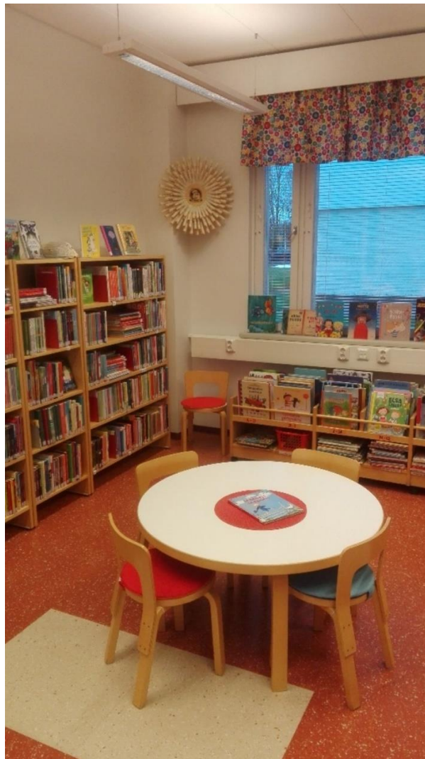
Kuva 1. Ylistaron monipalvelukirjaston lastenosasto.

Ylistaron monipalvelukirjastossa pidetään satutuokioita ja järjestetään kouluvierailuja. Ylistarossa toteutetaan samaa yllä mainittua Seinäjoen kulttuurikasvatussuunnitelmaa. Uutena palveluna on kokeiltu kirjastokerhoa ja aivan uutena ollaan nyt aloittamassa lukukoiratoimintaa. Tiedonhakuopetusta tarjotaan tarpeen mukaan. Lastenkirjastotyö on kirjastonjohtajan vastuulla, mutta vastuuta on jaettu kirjastovirkailijalle, koska johtaja on pian jäämässä eläkkeelle. Lastenkirjastotyön yhteistyötoimia ovat päiväkodit, jotka tulevat säännöllisesti satutuokioihin, koulut, MLL, jonka kanssa on järjestetty satupiknik ja kirjavinkkausta, 4H-yhdistys ja seurakunta. Lisäksi neuvolassa ja hammashoitolassa pidetään siirtokokoelmaa. (H1.)