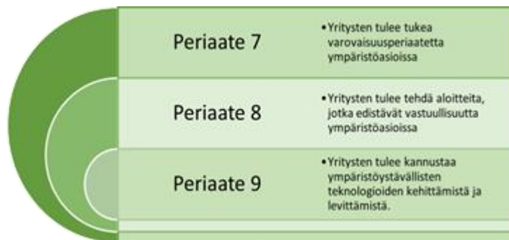
Kuvio 3: Global Compactin ympäristötavoitteet (Kuva laadittu Global Compact Network Finland 2021- verkkosivun tavoitteiden pohjalta).

10 periaatteesta kolme liittyy suoraan ympäristöön: