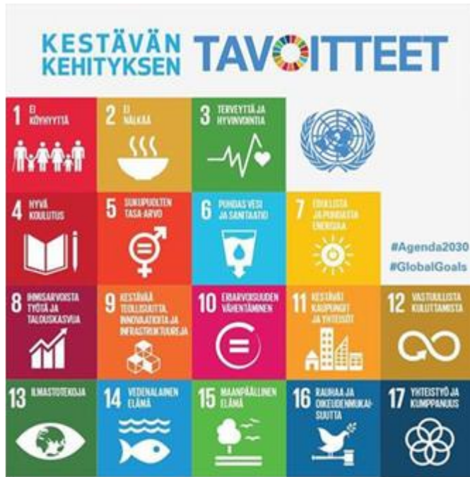
Kuvio 2: Kestävän kehityksen tavoitteet (Ulkoministeriö 2021a.)