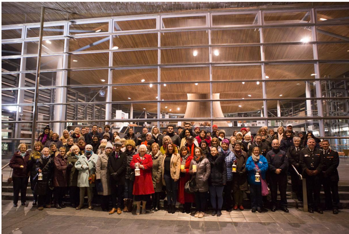
Gwynos yng Ngolau Canhwyllau 2018