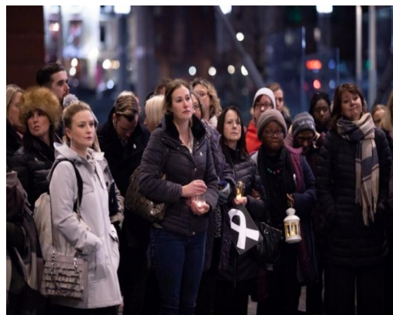
Gwynnos yng Ngolau Canhwyllau 2018