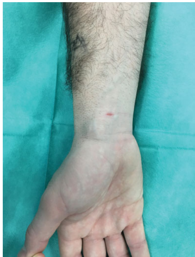
Fig. 1 Aspecto clínico habitual del ganglión volar de muñeca.

Desde Octubre de 2015 hasta Enero de 2018, se incluyeron todos los pacientes remitidos a la Unidad de Cirugía de Mano para valoración de G.V.M. Los criterios de inclusión son pacientes de edad comprendida entre 18 y 65 años que