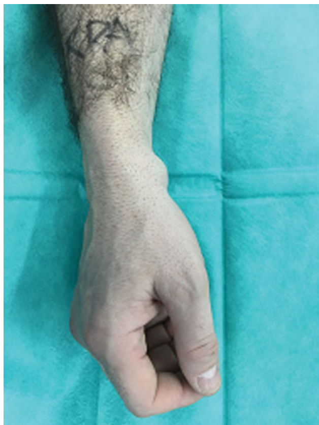
Fig. 2 Aspecto clínico habitual del ganglión volar de muñeca.

presentaban G.V.M. primario o recidiva con presencia de limitación funcional, dolor o problema cosmético y de más de 6 meses de evolución. Los criterios de exclusión fueron pacientes fuera del rango de edad y tiempo de evolución previamente establecido, infección activa, deformidad severa o secuelas de fractura previa o presencia de G.V.M. dependiente de vaina tendinosa. Un grupo de 21 pacientes consecutivos (12 hombres, 9 mujeres) con una media de edad de 42 años (rango 36–51) constituyeron la población a estudio, no hubo pérdidas de seguimiento.