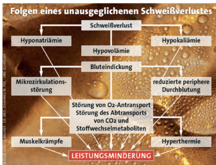
► Abb. 1 Folgen eines unausgeglichenen Schweißverlustes.

Während der Aktivität müssen Trinkmenge und Inhaltsstoffe des Getränks mit Intensität, Dauer und Art der sportlichen Aktivität korrespondieren, um die individuellen Sportziele effektiv zu unterstützen. Der Hydratationsstatus zu Beginn der Aktivität, die während des Sports zu erwartenden individuellen Schweißverluste und die Verträglichkeit sind ebenfalls zu berücksichtigen. Die individuell-