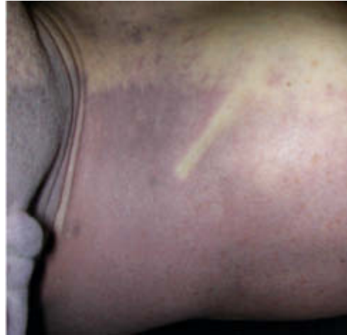
Abb. 2 Bis ca. 10 Stunden nach dem Tod lassen sich die Totenflecke wegdrücken.