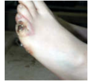
Abb. 6 Im Fall des plötzlichen Todes einer Bäuerin bei der Arbeit wurde zunächst ein natürlicher Tod bescheinigt. Erst bei der zweiten Leichenschau wurde die Leiche entkleidet. Es fand sich eine Strommarke am Fuß, sodass unter Berücksichtigung der Fallumstände von einem Unfalltod auszugehen war und die Angehörigen der Verstorbenen Ansprüche bei einer Unfallversicherung geltend machen konnten.

Todeszeitschätzung | Der Gesetzgeber sieht vor, dass sich der leichenschauende Arzt zur Todeszeit äußert. Zur Eingrenzung kann die Phänomenologie der sicheren Todeszeichen (▶ Tab. 1 ) herangezogen werden.