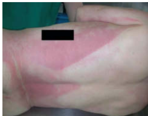
Abb. 3 Hellrote Totenflecke bei Kohlenmonoxidvergiftung.

Flecke richtig unterscheiden | Ein genaues Hinschauen verlangt u.U. auch die Unterscheidung