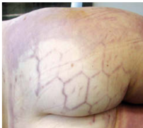
Abb. 5 In diesem Fall ergab sich erst, als der Leichnam ausgezogen und umgedreht worden war, der entscheidende Hinweis auf die Todesart. Hier ist der Profilabdruck eines Reifens zu erkennen – die Frau wurde mutmaßlich von einem LKW überrollt.

es helfen, die typischen Stellen (z. B. Nacken bei Rückenlage) mit Fingerkuppen- oder -nageldruck zu untersuchen und auf die auftretenden Farbunterschiede zu achten.