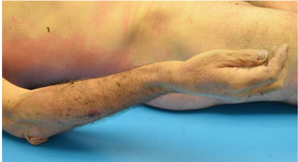
Abb. 4 Totenstarre. Auffallend ist die Fehlstellung des Handgelenks. Die Obduktion ergab eine Radiusfraktur.

zwischen Totenflecken und Hautunterblutungen. Um Hämatome zu erkennen, ist es hilfreich, beim Betasten auf Schwellungen und Verhärtungen des Gewebes zu achten und nach Hautschürfungen zu suchen.