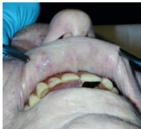
Abb. 7 Stauungsblutungen in der Mundvorhofschleimhaut. In diesem Fall führte Erhängen zum Tod.