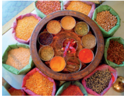
Abb. 1 Nicht immer reichen diätetische Maßnahmen zur Milieu-Regulierung aus.

„Immer sollte man zuerst den Körper mit Oleation und Sudation (vorbehandeln) und dann die Ausleitung nach oben (Emesis) und (dann) nach unten (Purgieren) durchführen. Danach wendet der weise Arzt Einläufe (basti-karma) und daraufhin nasale Anwendungen (nasya) an. In dieser Reihenfolge und dem individuellen Bedarf angemessen setze man die oben (genannten) Maßnahmen ein. Im Anschluss daran verabfolge man effektive geweberegenerierende (rasÁyana) und reproduktionsfördernde (véÖya) Mittel unter Berücksichtigung zeitlicher Faktoren (Jahreszeit, Alter, Medikationszeiten etc.). Auf diese Weise entstehen keine Krankheiten; die Gewebe werden in einem gesunden Zustand erhalten und genährt, und der Alterungsprozess vollzieht sich langsam.“