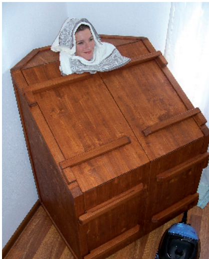
Abb. 3 Die Sudation gehört zu den vorbereiteten Maßnahmen.

dischen Sprachgebrauch eine verstärkte Aktivität der doÖas und somit Krankheits-symptome hervor.