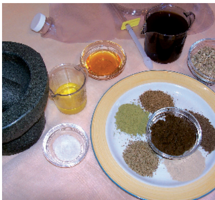
Abb. 4 Bestandteile eines Dekokt-Einlaufs.

tion meist leicht zu beheben. Schwerwiegender sind diese Auswirkungen, wenn beim Patienten bereits im Vorfeld eine allgemeine Schwächung bestanden hat, wie bei einem durch Alter (Kinder, ältere Patienten) oder Krankheit reduzierten Allgemeinzustand (inkl. Schwangerschaft) oder bei ausgeprägten Organschwächen (besonders Herz-Kreislauf-, Nieren- und Lebererkrankungen).