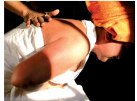
Abb. 2 Während der Ausleitung ist die sorgsame Begleitung sehr wichtig.

Akkumulationen können in Form von schädigenden Stoffen wie Toxinen, Allergenen und freien Radikalen direkt Störungen hervorrufen. Eine solche substanzbezogene Sichtweise ist der Schulmedizin eigen. Sie können jedoch auch komplexe atmosphärische Veränderungen im Körper bewirken. Diese Milieuverschiebungen finden syste-