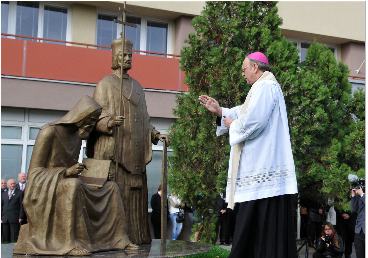
Odhalenie súsošia sv. Cyrila a Metoda v Trnave