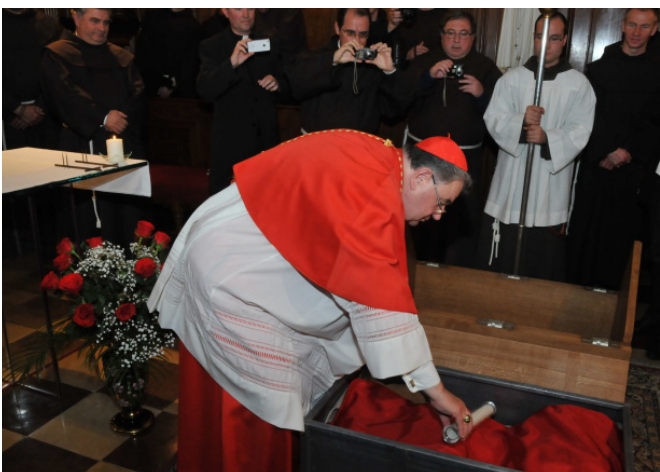
V Prahe zavřili proces blahorečenia štrnástich pražských mučeníkov