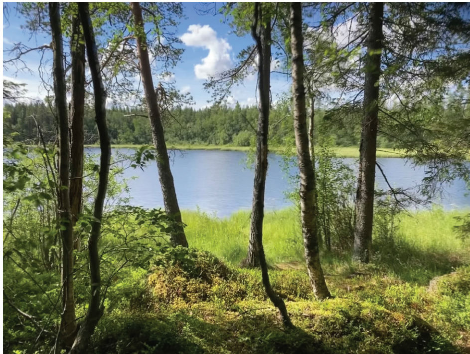
Jämsänkallion reitti Kotojärven rannan varrella.

Jämsän kylä ja kallio sekä Jämsänjärvi eli Kotojärvi ovat saaneet nimensä kylälle 1500-luvulla Jämsän pitäjältä vesiteitse kulkeutuneiden erämiesveljesten mukaan.