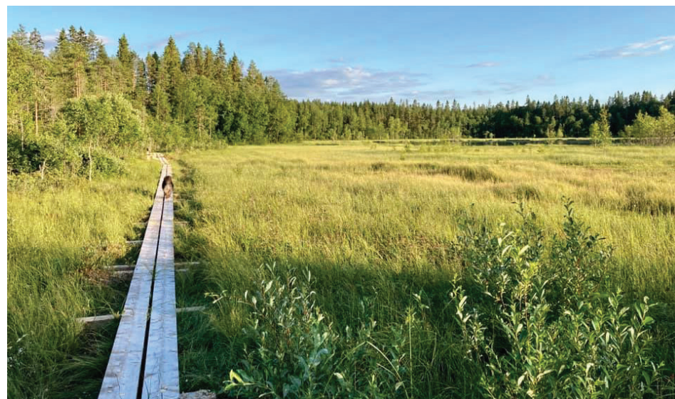
Jämsänkallion reitin pitkospuuta.

Osa kohteista pitää sisällään mielenkiin-toisen historian, jonka toivoisi pysyvän hengissä. Nämä ”kämpin tarinat” elä-vät kertojiansa mukana, mutta vain niin kauan kuin kertoja riittää.