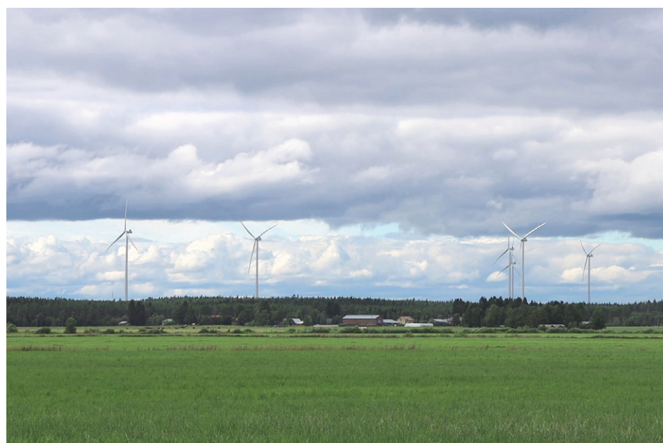
Tuulivoimaloita lähellä Kannusta.

Toholammin kunnan kukkarossa tuulivoima on jo nyt näkynyt. Myönnetty 65 rakennuslupaa ovat tuoneet peräti 520 000 euroa rakennuslupatuloja.