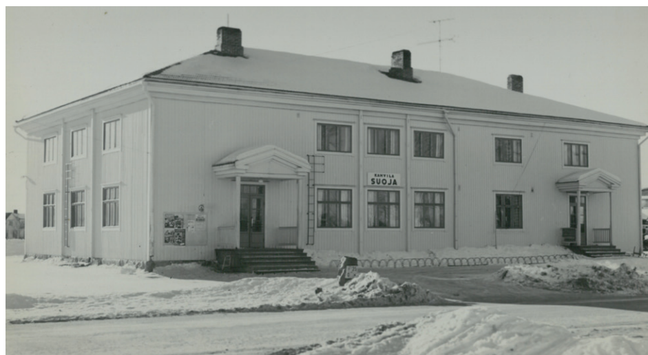
Mutkia on ollut matkassa. Kirjasto on elänyt monivaiheisen elämän Toholammilla. Kuvassa Lampin Suoja 1960-luvun lopulta.

Kunnassa kerättiin viinaveroa ja vuonna 1875 sitä tuli 300 markkaa. Näiden varojen käytöstä päätettiin pitäjän kokouksessa pappilassa. Kirjasto sai 200 markkaa ja 100 markkaa pistettiin koulukassan perustamiseen. Se oli kirjaston ensimmäinen avustus kunnalta.