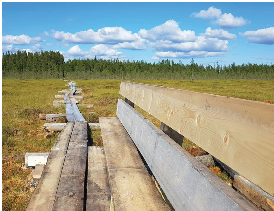
Pitkospuut Kopsanevan lintutornille.

Myös kesän pyöräilykampanjat ovat olleet suosittuja. Tämän kesän kampanja jatkuu elokuun loppuun saakka ja rinnan ovat kulkeneet postilaatikkokampanja, valokuvakilpa ja valtakunnallinen kilometrikisa. Maastopyöräilykin onnistuu retkeilyreittien pitkospuilla sekä Kuusiston kuntoradalla.