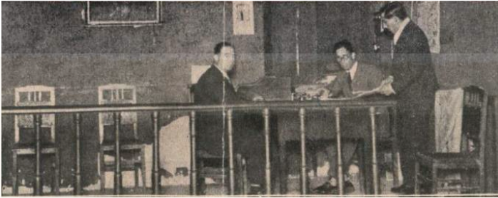
Salón de Plenos 1927

De la libertad altomedieval de los concejos abiertos, socavada a los largo de los siglos por el control real en la figura del Corregidor, la autoridad señorial y la aristocracia local, llegamos al siglo XIX en el que la Constitución de 1812 pondrá las bases del nuevo régimen constitucional y la representatividad de los nuevos Ayuntamientos que se irán desarrollando en diferentes constituciones y estatutos, hasta llegar a los plenamente democráticos en 1979.