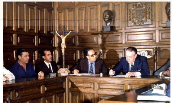
1974. Visita Gobernador Civil. Salón de Plenos.

Una vez que contábamos ya con Casa Consistorial, las reuniones vecinales tendrían lugar en su “Sala Capitular”; las convocatorias se fijaban en el tablón de anuncios y en aquéllos lugares frecuentados por los vecinos, generalmente, la puerta de la Iglesia, previo pregón, dando un último aviso de comienzo inminente mediante un “toque de campana”, por lo menos, hasta 1909, como podemos leer en muchas de las actas de este año: