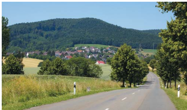
Blick auf Holenberg