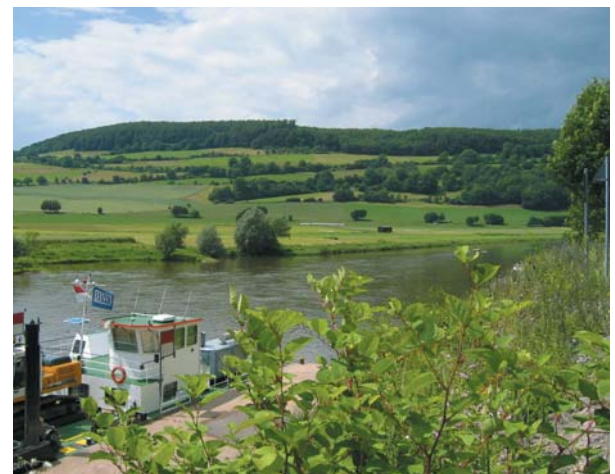
Weser zwischen Reileifzen und Dölme