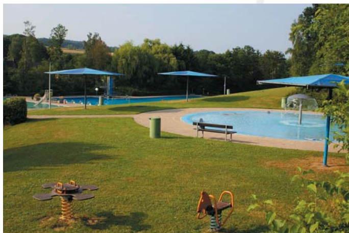
Schwimm- und Freizeitzentrum Bevern