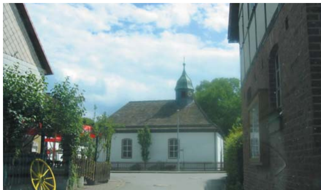
Kirche in Dölme