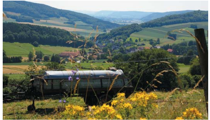
Blick auf Lütgenade

Vom. Versorgungshof der Grafen Everstein, ab 1493 Sitz des Amtes Forst.