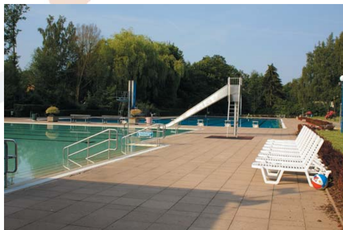
Schwimm- und Freizeitzentrum Bevern