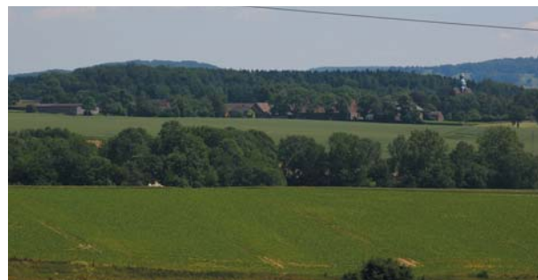
Blick auf Amelungsborn

Samtgemeindeverwaltung Bevern zugl. Verwaltung des Flecken Bevern, Angerstr. 13 A, 37639 Bevern, Postfach 11 35, 37636 Bevern, Fon 05531/99 44-0, Fax 05531/99 44 50 www.bevern.de - e-mail: samtgemeinde@bevern.de