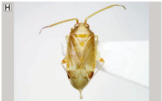
A : 山麓部の落葉広葉樹林の二次林 (FIT-1) B : トチノキ, ホオノキ等が優占する落葉広葉樹の自然林 (FIT-2) C : アカマツ二次林 (FIT-3) D : クリの大径木を中心とした落葉広葉樹の二次林 (FIT-5) E : 山頂部のカシワ林 (FIT-6) F : FIT トラップの設置状況 G : コリヤナギグンバイ (乾燥標本) H : クヌギヒイロカスミカメ (乾燥標本)

2009年6月13日 2009年5月9日 2009年5月9日 2009年5月9日 2009年5月9日 2009年5月9日