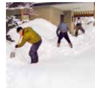
▲4人一组でスコップなどを使い除排雪する様子

航空自衛隊東北町分屯基地隊員は東北町社会福祉協議会と共に、1月下旬から2月上旬にかけて、一人暮らし高齢者世帯などの除雪ボランティアを実施しました。