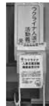
設置場所 本庁舎玄関