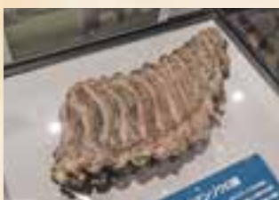
昭和36年、小川原湖畔で見つかったナウマンゾウの化石