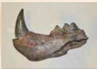
平成10年、小川原湖の湖底で見つかったトラの化石