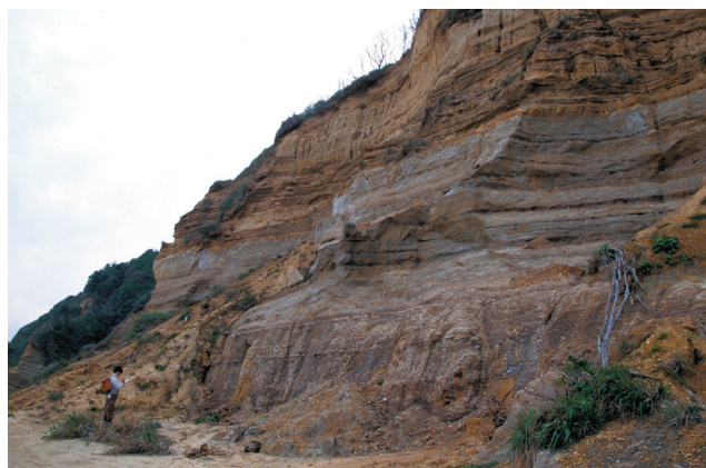
▲愛知県田原市六連町久美原に分布する渥美層群の植物化石産地（1995年、吉川撮影）。

収蔵庫のコンテナと標本箱に整理された渥美層群産の葉化石（上）、液浸標本の状態とサンプル瓶に保管された渥美層群産種実化石（下）。