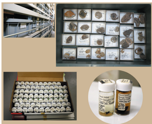
▲黒田コレクションの収蔵状況。

黒田コレクションの内容は、黒田氏が1950年代から1990年代にかけて収集した61科119属281種の葉化石及び種実化石等である。葉化石は印象化石のものも多く、果実や茎等の部位も若干含まれている。種実化石等は、刺、枝、芽等の部位も含み、ほとんどが液浸標本で1瓶に多数入れられているものも多い。液浸標本の中には、菌類4点の他、昆虫が1点、「ケムシの糞」とされたものが2点含まれている。個数としては葉化石等が557個、液浸標本中の化石が約3,800個である。寄贈時に黒田氏に標本番号と標本ラベルをつけていただいたが、番号の重複や間違いがあったため黒田氏の標本番号を仮番号とし、改めて豊橋市自然史博物館化石資料登録番号をつけ直した。その結果、登録点数は1,113点（葉化石：406点、液浸標本：707点）となった。