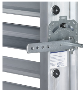
FESTSTELLVORRICHTUNG AN JZ-AL, JZ-HL-AL

Die Feststellvorrichtung befindet sich immer zwischen der ersten und zweiten Lamelle von oben