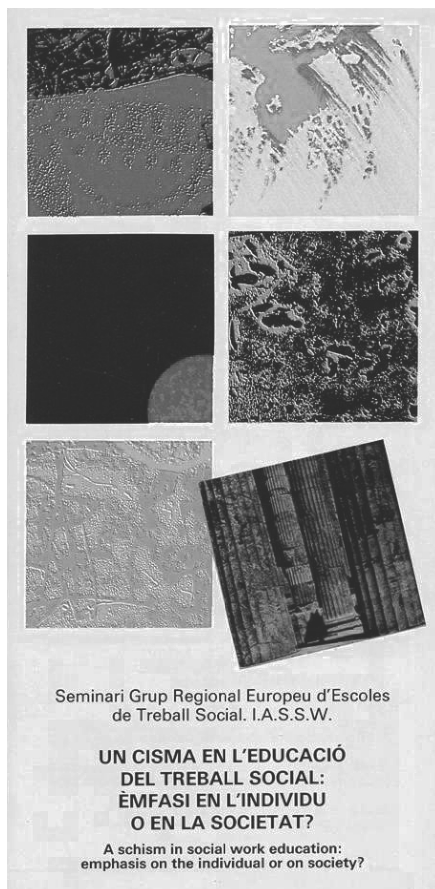
Foto 10. Cartell promocional del Seminari del Grup Europeu d'Escoles de Treball Social de Sitges (1987)