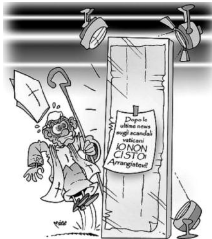
L'Astensione della Sindone