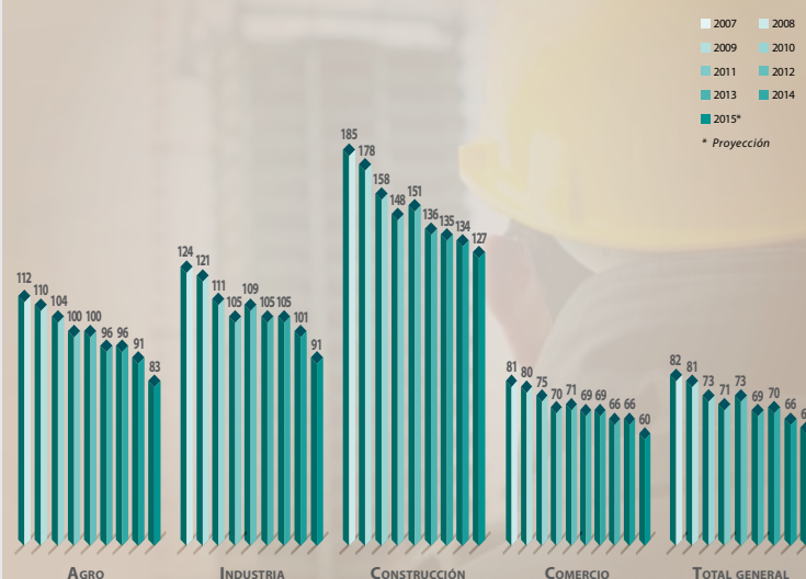
EVOLUCIÓN DE LOS ACCIDENTES POR SECTOR DE ACTIVIDAD CADA 1.000 TRABAJADORES CUBIERTOS