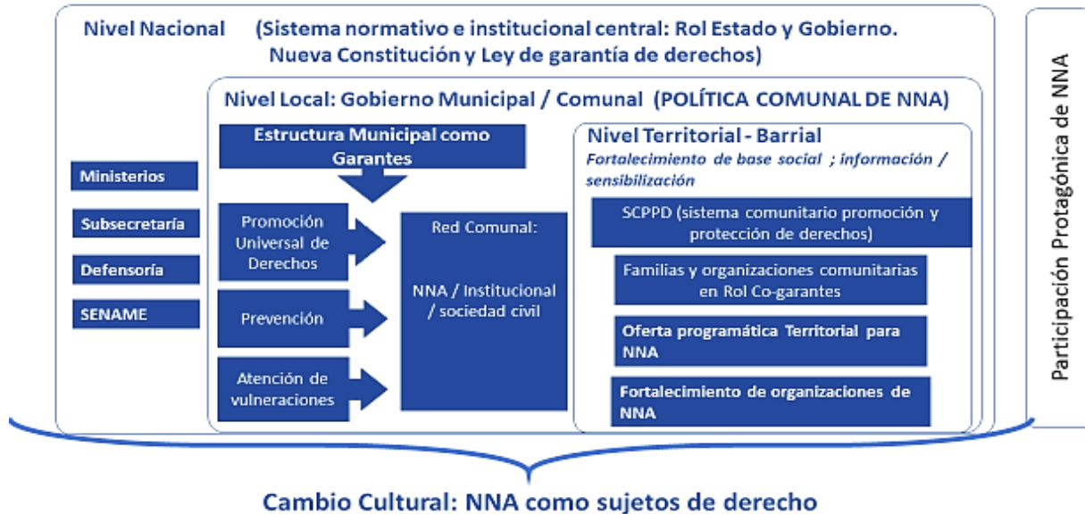
Esquema 3: Propuesta que reformula esquema 1, integrando los primeros aprendizajes del proceso.