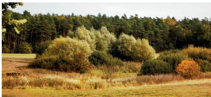
Dolgeseen-Ragollinsee – vermoorte Senke