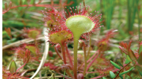
Rundblättriger Sonnentau