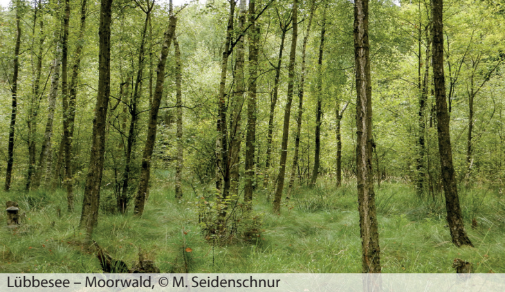
Lübbesee – Moorwald