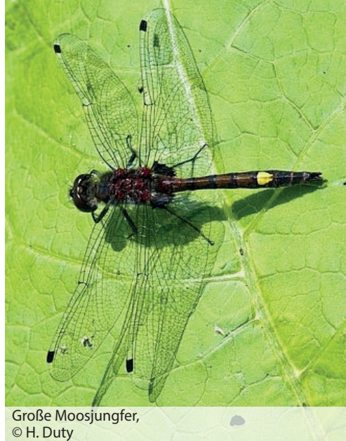
Große Moosjungfer, © H. Duty