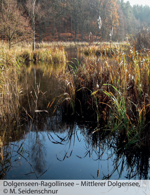
Dolgeseen-Ragollinsee – Mittlerer Dolgensee