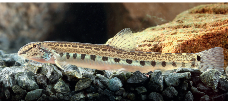
Steinbeißer, © G. Farkas , Fotolia.com