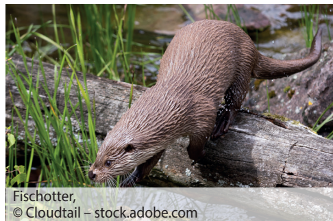
Fischotter, © Cloudtail – stock.adobe.com