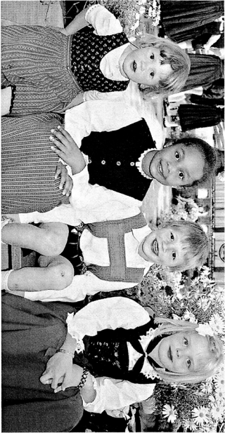
Gelebte Integration: Der Tiroler Strachtenverband will Kinder und Jugendliche in das soziale Leben der jeweiligen Gemeinden einbinden und Kontakte über regionale Grenzen hinaus knüpfen.

„Wir distanzieren uns ganz klar von nationalsozialistischem Gedankengut“, stellt Gredler im Gespräch mit der Tiroler Tageszeitung unmissverständlich fest. „unsere Aufgaben sind die Pflege, Erhaltung und Weitergabe von Volkstanz, Tracht und Brauchtum. Wir sind nicht die Träger eines nationalistisch geprägten Wertesystems. Gegenüber durch nichts zu rechtfertigender Verdrängung verwehren wir uns mit aller Deutlichkeit.“