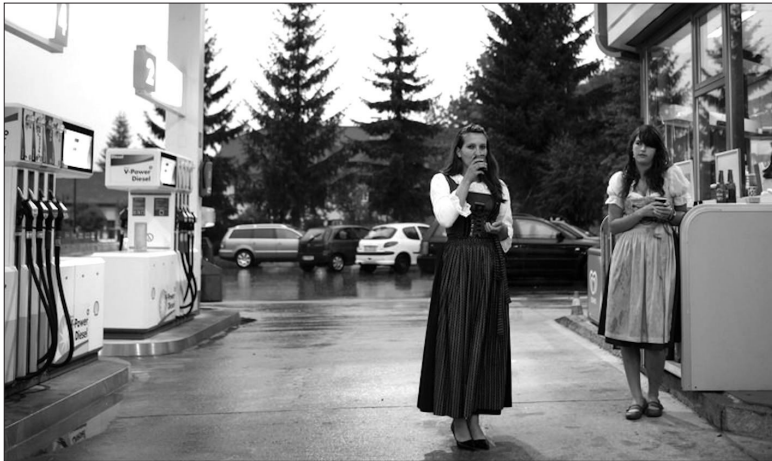
Abb. 1: »[Tiroler] Rennen nur in Trachten rum Das stimmt nicht, obwohl es manchmal praktisch wäre. So ein Dirndl ist auch im Sommer luftig leicht (außer die traditionellen Trachten, welche meist aus schweren Stoffen genäht sind) und steht jeder Frau, ob rund, dünn, alt oder jung. Und die waschresistenten Lederhosen sind sowieso der Hit. Auf Zeltfesten und Prozessionen aber ist das Tiroler Gewand für jeden traditionsbewussten Einheimischen ein Muss. Vielerorts im Gastgewerbe unter den Kellnerinnen und Kellnern auch. Hier nicht immer ganz freiwillig.«

Bemerkenswert ambivalent sind die aktuellen Botschaften der Tiroler Tourismuswerbung in ihrem Blog. Während teilweise unverhohlen »Noch heute ist Tracht und Tirol untrennbar verbunden« 13 proklamiert wird, wird an anderer Stelle die Vorstellung, alle Tiroler »rennen nur in Trachten rum« als zwar populäres aber unzutreffendes Vorurteil zurückgewiesen, allerdings auf der Bildebene in Form einer pseudodokumentarischen Werbefotografie zugleich wieder aufgerufen: 14