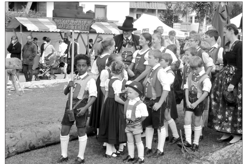
Abb. 3: Handwerksfest Seefeld, 14. September 2014

Noch deutlicher, weil zugleich performativ eingebettet und situativ erlebbar, erscheint dieser Effekt im Kontext einer Aufnahme, die in einer feldforschenden Beobachtungssituation bei einem Umzug auf einem Handwerksfest in Seefeld, einer Tiroler Gemeinde in der Nähe von Innsbruck entstand. Auf dieser dokumentarischen Fotografie ist zu sehen, wie die Trachtengruppe »D’Koasara Kufstein« von einem dunkelhäutigen Buben als Schildträger angeführt wird: