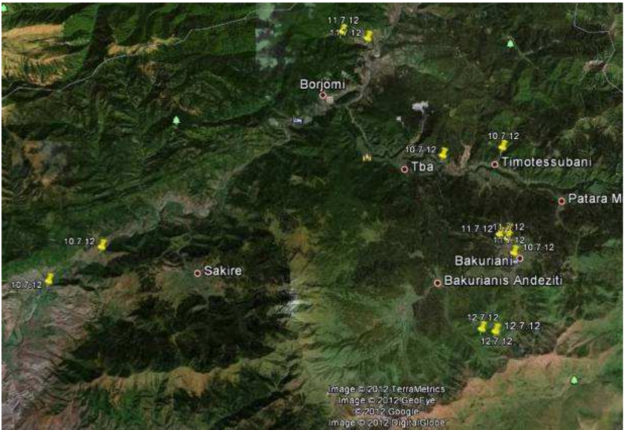
Abb.2: Aufenthalte rund um Bakuriani/Kleiner Kaukasus