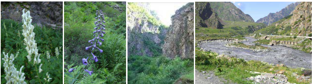
Abb.27: Aconitum orientale , Delphinium flexuosum , Eingang zur Schlucht und Tergi bei Gveleti.