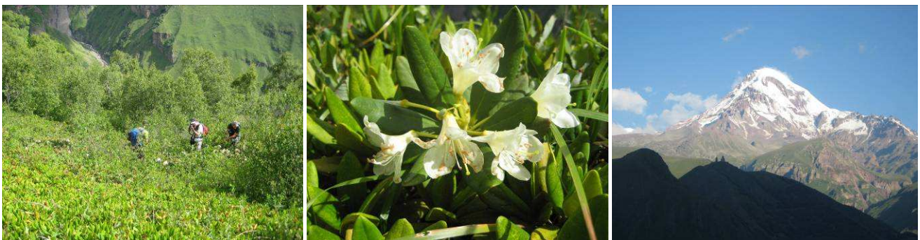
Abb.20: Übersicht 1.Standort, Rhododendron caucasicum und Blick auf den Mount Kazbek.

Leontodon hispidus (Asteraceae) Lotus corniculatus (Fabaceae) Nardus stricta (Poaceae) Persicaria carnea (Polygonaceae) Persicaria vivipara (Polygonaceae) Plantago caucasica (Plantaginaceae) Platanthera chlorantha (Orchidaceae) Polygala alpicola (Polygalaceae) Primula algida (Primulaceae) Pulsatilla violacea (Ranunculaceae) Ranunculus oreophilus (Ranunculaceae) Rhinanthus minor (Onobrancheaceae) Scabiosa caucasica (Caprifoliaceae) Silene linearis (Caryophyllaceae) Taraxacum stevenii (Asteraceae) Trifolium ambiguum (Fabaceae) Trifolium repens (Fabaceae) Trifolium trichocephalum (Fabaceae) Vicia purpurea (Fabaceae)