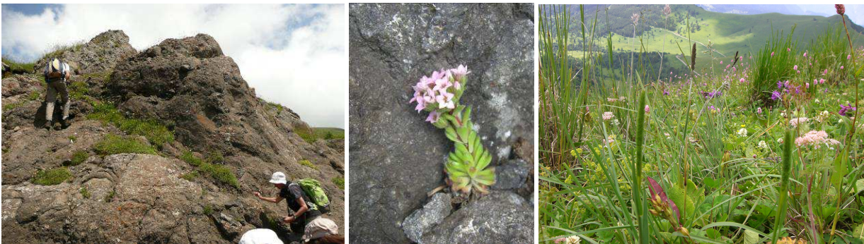
Abb. 13: Blick auf eine Felskante, Rosularia pilosa , artenreiche Weide.

Platanthera bifolia (Orchideaceae) Pulsatilla violacea (Ranunculaceae) Rhinanthus minor (Orobanchaceae) Silene multifida (Caryophyllaceae) Tephrosieris caucasigena (Asteraceae) Trifolium ambiguum (Fabaceae) Trifolium pratense (Fabaceae) Valeriana sp. (Valerianaceae) Veratrum sp. (Melanthiaceae) Vicia cf. incana (Fabaceae)