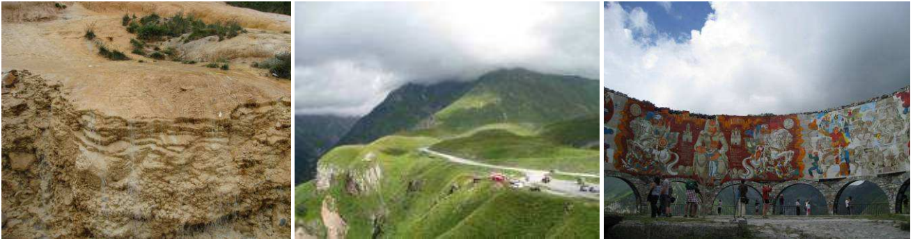
Abb.31: Travertin-Ablagerungen, Blick auf den Kreuzpass und Monument mit Mosaikbild.