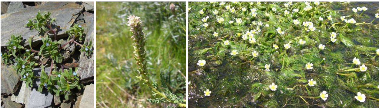
Abb.26: Trigonocaryum involucreatum , Myricaria germanica und Ranunculus trichophyllus .

Veronica anagallis - aquatica (Veronicaceae)