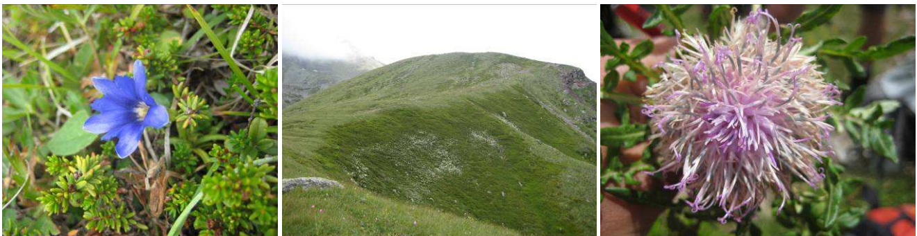
Abb.21: Gentiana pyrenaica (2.Standort), Bergrücken mit Kuppe (3. Standort) und Jurinella subacaulis (4.Standort).