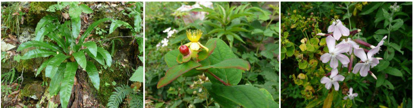
Abb.11: Asplenium scolopendrium , Hypericum androsaemum und Saponaria officinalis .

Scutellaria altissima (Lamiaceae) Selaginella helvetica (Selaginellaceae) Stachys sylvatica (Lamiaceae) Staphylea colchica (Staphyleaceae) Tamus communis (Dioscoreaceae) Tanacetum parthenifolium (Asteraceae) Telekia speciosa (Asteraceae) Tilia begoniifolia (Malvaceae) Ulmus glabra (Ulmaceae) Valeriana alliariifolia (Valerianaceae) Veronica persica (Plantaginaceae) Viburnum opulus (Adoxaceae) Vincetoxicum scandens (Apocynaceae)