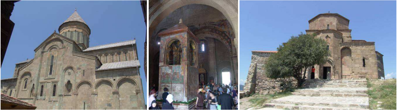
Abb.16: Die Sweti-Zhoveli-Kathedrale in Mzcheta mit Ansicht der Säule im Inneren, welche an die Legende um den Krichenbau erinnert; Eingangsbereich des Dschwari-Klosters.

Unsere Fahrt von Mzechta nach Stepantsminda/ Kazbegi (1700 m NN) führte entlang der Georgischen Heeresstraße.