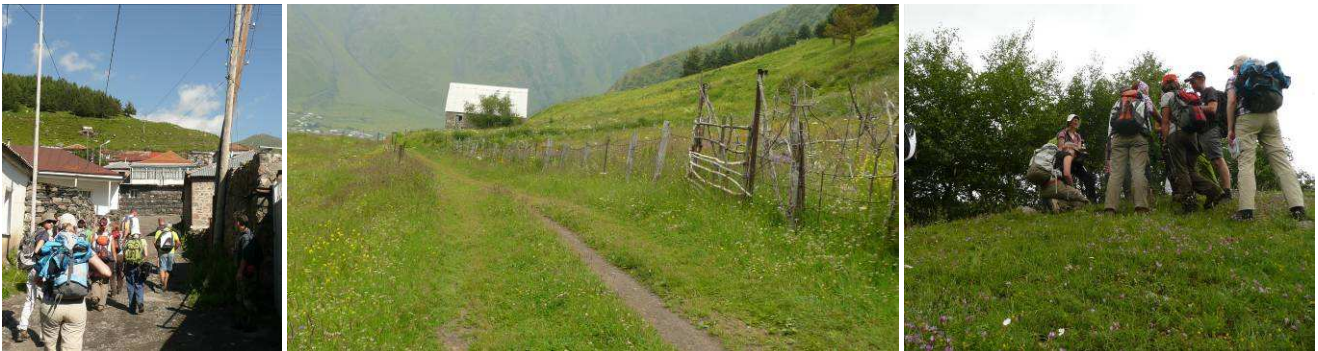
Abb.18: Start im Dorf Gergeti, Bergwiese oberhalb des Dorfes und botanischer Stop an einer Magerwiese.

Pinus sosnowskyi prägt die meist in den 1940er-Jahren angepflanzten Nadelwälder der südexponierten Flächen. Eine Ausnahme bildet die Dariali-Schlucht, wo P. sosnowskyi auch natürlich vorkommt. Viele Dörfer Georgiens besitzen geschützte Waldbereiche, so auch Gergeti mit einem Mischwald unterhalb des Klosters.