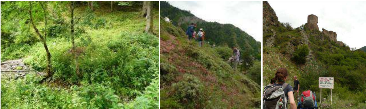
Abb. 7: Bachlauf (Standort 1), Tragacanth-Vegetation mit Astragalus microcephalus und Festung Sleska.

Der letzte Stop fand auf dem Rückweg statt. Dieser Stop befand sich unmittelbar neben der Straße. Das Substrat war ebenfalls vulkanischen Ursprungs. Dieser Stop diente der Wiederholung der Pflanzenarten der Tragacanth-Vegetation. Er befand sich auf einer Meereshöhe von 884 m. Koordinaten: N 41°45.660' EO 43°12.994'. Im Protokoll werden nur jene Pflanzen erwähnt, die neu identifiziert wurden.