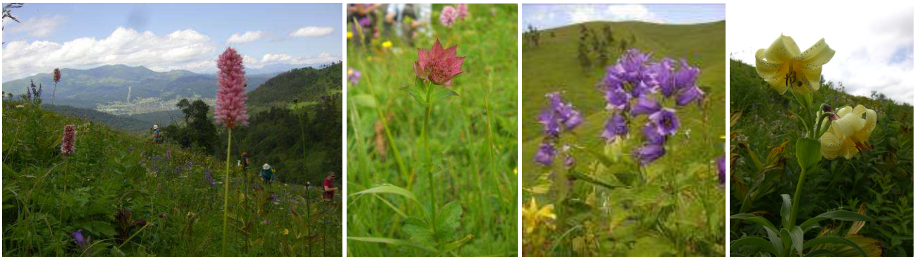
Abb.12: Blick auf die Weide, Astrantia maxima , Campanula latifolia und Lilium szovitsianum .

Carex paniculata (Cyperaceae) Crepis marschalii (Asteraceae) Dactylorhiza incarnata (Orchidaceae) Laubmoos (Mniaceae)