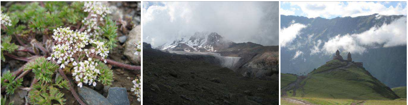
Abb.24: Chaerophyllum humile , Blick auf den Gletscher und Dreifaltigkeitskirche Tsminda Sameba.

(Nakhutsrishvili et al., 2005 ; Kvastiani et al., 2012)