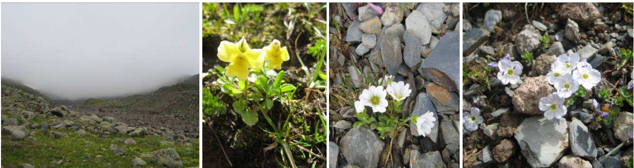
Abb.23: Blockschutthalde (8. Standort), Viola minuta , Cerastium kazbek und Veronica telephifolia .