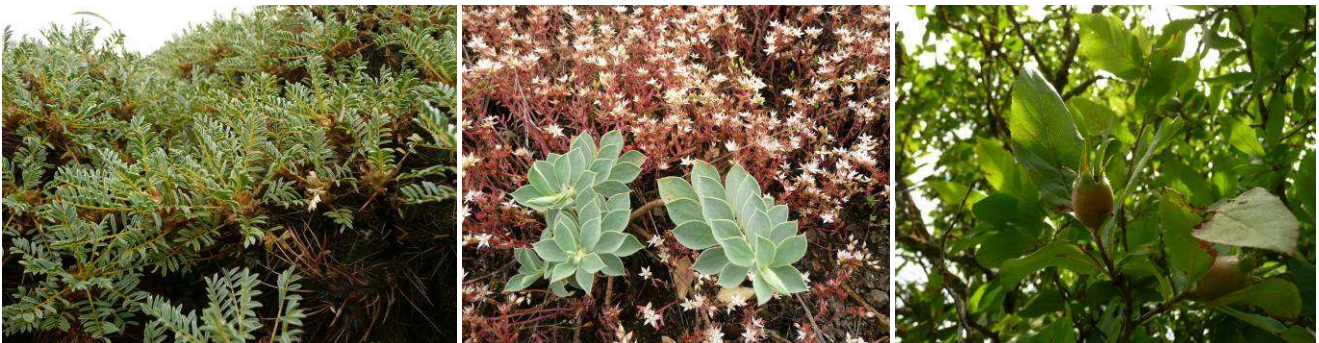
Abb.8: Astragalus microcephalus , Euphorbia pontica und Mespilus germanica .

Fumana procumbens (Cistaceae) Galium verum (Rubiaceae) Lactuca wilhelmsii (Asteraceae) Lomelosia rotata (Dipsacaceae) Onosma sericea (Boraginaceae) Oxytropis sp. (Fabaceae) Poa bulbosa (Poaceae) Quercus macranthera (Fagaceae)