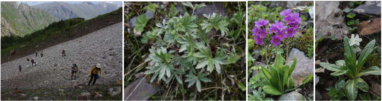
Abb.29: Erste Schneefeld-Querung, Alchemilla sericea , Primula amoena und P. bayerni .

Boden eingeschlossen geblieben sind, obwohl der Gletscher in diesen Bereichen nicht mehr wächst. Pionierarten wie der Säuerling ( Oxyria digyna ), Weidenröschen ( Epilobium spp.) und die Wollige Taubnessel ( Lamium tomentosum ) können bereits auf sehr flachem Schutt wachsen. Sie wurzeln meist nicht vertikal, sondern eher horizontal, was durch die Instabilität und häufige Bewegung des Substrats bedingt ist. Die sehr steilen Hänge der Seitenmoränen werden sehr lange nicht besiedelt, da sie noch häufiger und stärker rutschen. Höchstens einige angedrückt-kriechend wachsende Arten wie Veronica telephifolia können hier Fuß fassen.