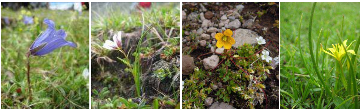
Abb.22: Campanula biebersteiniana , Lloydia serotina , Saxifraga flagellaris und Gagea sulphurea .