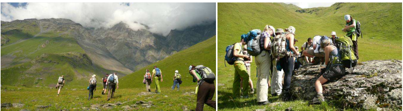
Abb.19: Aufstieg an den steilen Trockenhängen und Untersuchung eines Felsstandortes.

Nach einem ausgiebigen Mittagessen in der biologischen Station starteten wir direkt zu Fuß in Richtung des Mount Elia im Osten von Stepantsminda. Hauptziel der zweiten Tageshälfte waren die steilen, west-exponierten Trockenhänge, die gelegentlich mit Felsvegetation durchsetzt waren.