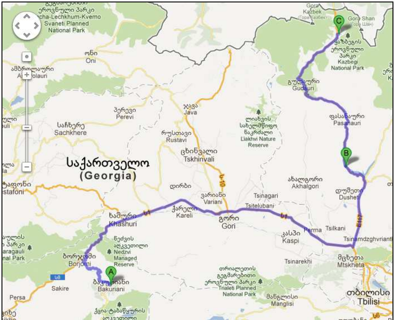
Abb.15: Tagesroute von Bakuriani bis Kazbegi

Unsere Fahrt ging von Bakuriani (1700 m NN) im Kleinen Kaukasus, über Borjomi nach Kvishketi, ab dort entlang des Flusses Kura nach Mzcheta.