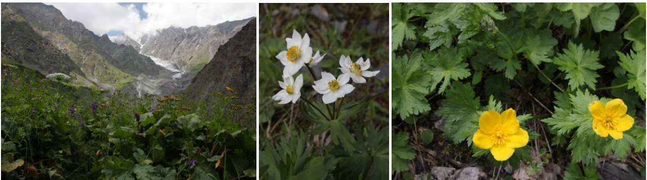
Abb.30: Hochstaudenflur mit Blick auf den Gletscher, Anemonastrum fasciculatum und Trollius patulus .