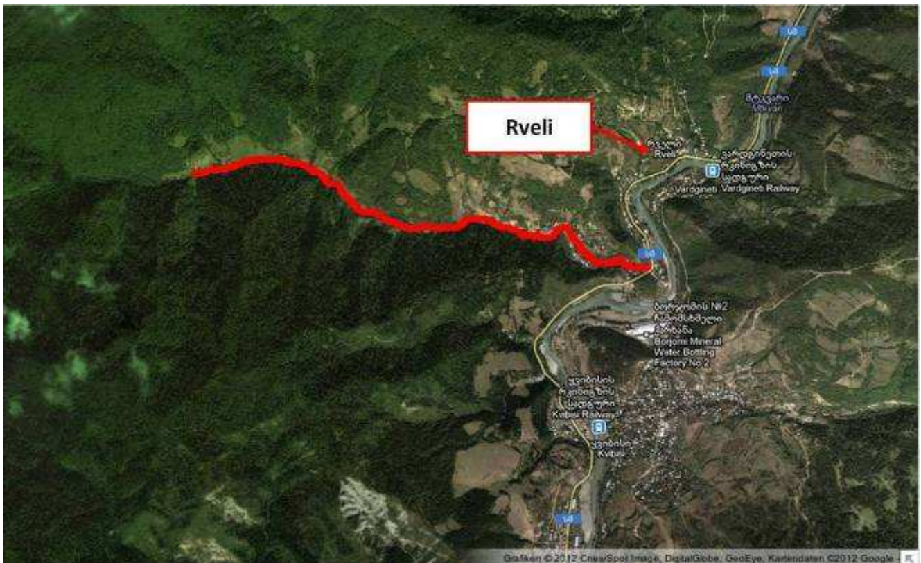
Abb.9: Verlauf der Tagesroute in der Schlucht Baniskhevi.

Am 11.7.2012 sind wir mit dem Bus von Bakuriani Richtung Borjomi gefahren und wenige Kilometer vor Rveli in die Schlucht Baniskhevi eingebogen, durch die der gleichnamige Fluss Baniskhevi fließt. Die Tagesroute ist in der Karte rot markiert.