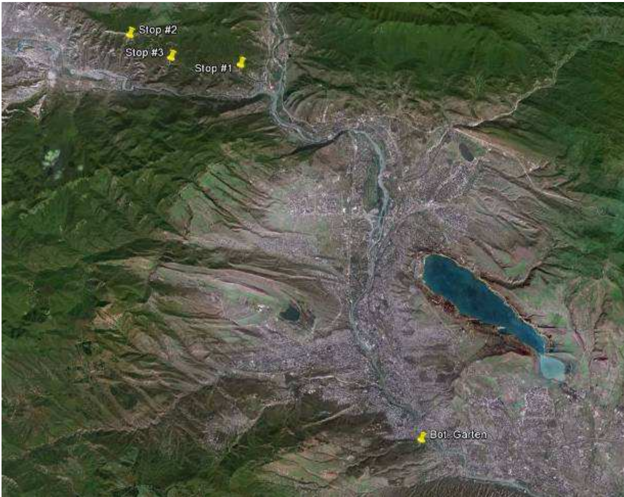
Abb. 4: Stops in Tbilisi und auf dem Weg nach Bakuriani am ersten Exkursionstag.

Mittag/Nachmittag: Schibljak-Vegetation nahe dem Kloster Shio-Mghvime