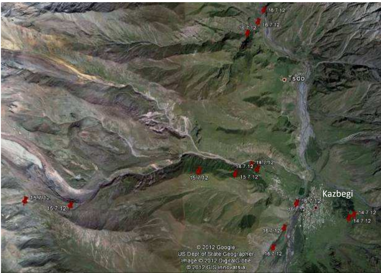
Abb.3: Aufenthalte rund um Kazbegi/Großer Kaukasus