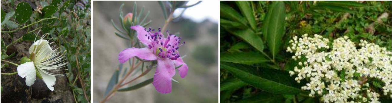
Abb.6: Capparis spinosa , Reaumuria alternifolia und Sambucus ebulus .

Auf der weiteren Fahrt über Borjomi bis nach Bakuriani konnten wir erste Blicke auf die Tragacanth-Hänge werfen, die vom Dornbusch Astragalus microcephalus dominiert sind.