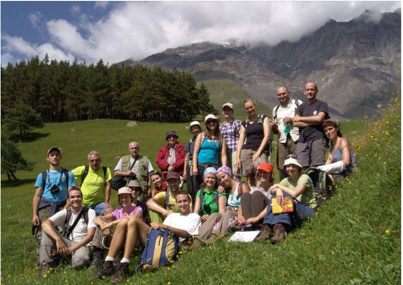
Abb.33: Gruppenfoto „Team Kazbegi“