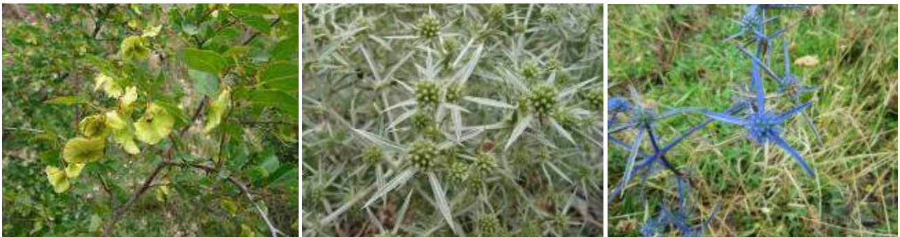
Abb.5: Paliurus spina-christi , Eryngium campestre und Eryngium bibersteinii .

Auf dem Weg zum Kloster Shio-Mghvime wurden die typischen Vertreter der Schibljak-Vegetation vorgestellt. Die lichte, offene Gebüschgesellschaft stellt die degradierte Ersatzgesellschaft der fast vollständig verloren gegangenen, natürlichen Waldvegetation dar. Die Strauchschicht wird häufig von submediterranen Arten ( Paliurus spina-christi ) und Juniperus -Arten ( J. oxycedrus , etc) dominiert. Im Unterwuchs finden sich Trockenrasenarten wie Bothriochloa ischaemum und Teucrium chamaedrys , sowie ruderale Elemente (z.B. Verbena officinalis ). Ausgangsgestein des Bodens ist der relativ weiche und junge Sandstein aus dem Eozän.