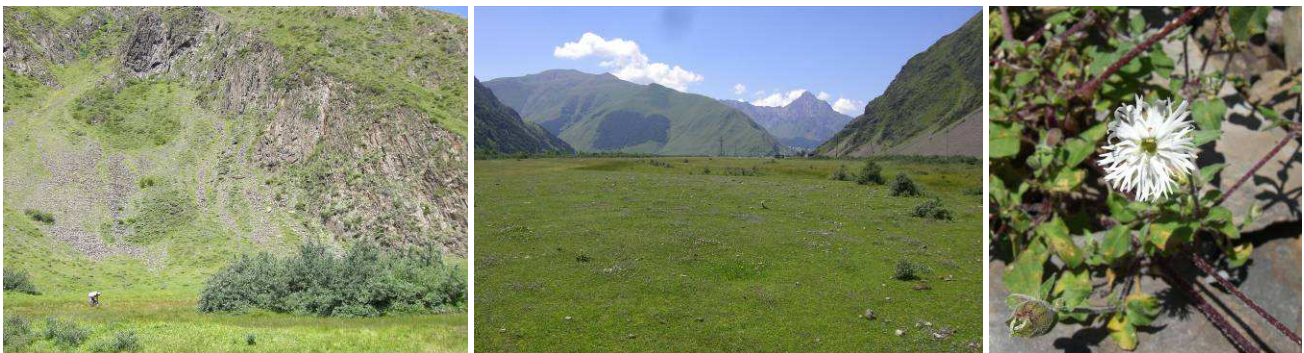
Abb.25: Felschutthalde (3. Standort) Flussalluvionen und Weide (4. Standort), und Silene lacera .

Anschließend geht es weiter entlang des Flussbettes des Tergi in Richtung Süden. Hier findet man noch ein großteils unverbautes, natürliches Flussbett mit einer beträchtlichen Geschiebeführung. Neben mehreren vernässten Standorten findet man auch breite Schotterflächen entlang des Flusses, welche die in Österreich stark gefährdete Myricaria germanica beherbergen.