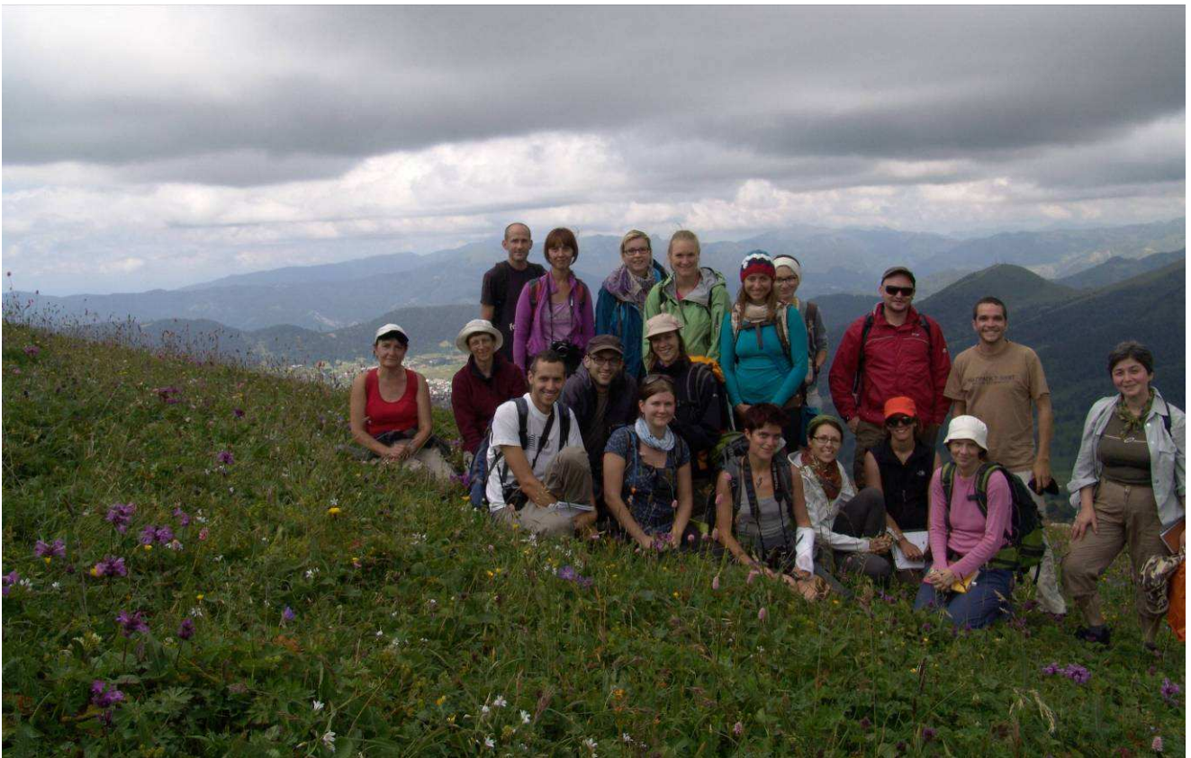
Abb.32: Gruppenfoto „Team Bakuriani“