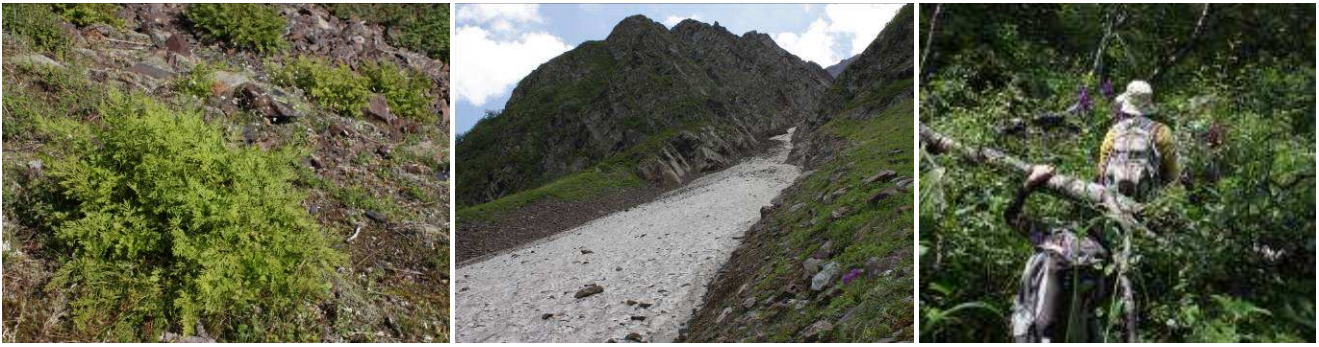
Abb.28: Silikatschutthalde mit Cryptogramma crispa (Standort 1), Lawinenrinne (Standort 2) und Wanderung durch den Birkenwald.