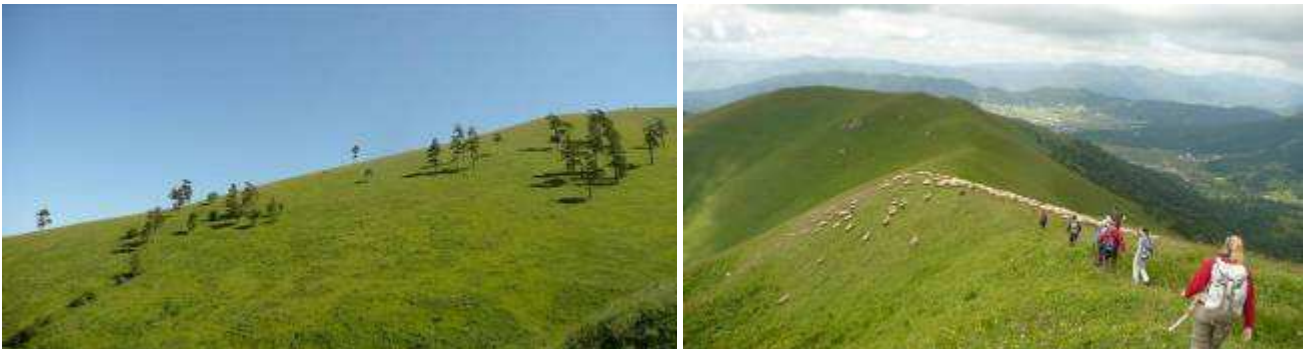
Abb.14: Blick auf die extensiv genutzte Weide mit einzelnen Bäumen und Abstieg entlang der Hügelkuppe.

Während des Abstieges zur Passstraße wird eine weitere Hochstaudenflur durchquert, welche im Artenspektrum der am Standort 1 entspricht. Hier findet man zwei neue Arten: Stachys balansae (Lamiaceae) und Orobanche caryophyllacea (Orobanchaceae) und außerdem Aconitum nasutum (Ranunculaceae) und Doronicum oblongifolium (Asteraceae).