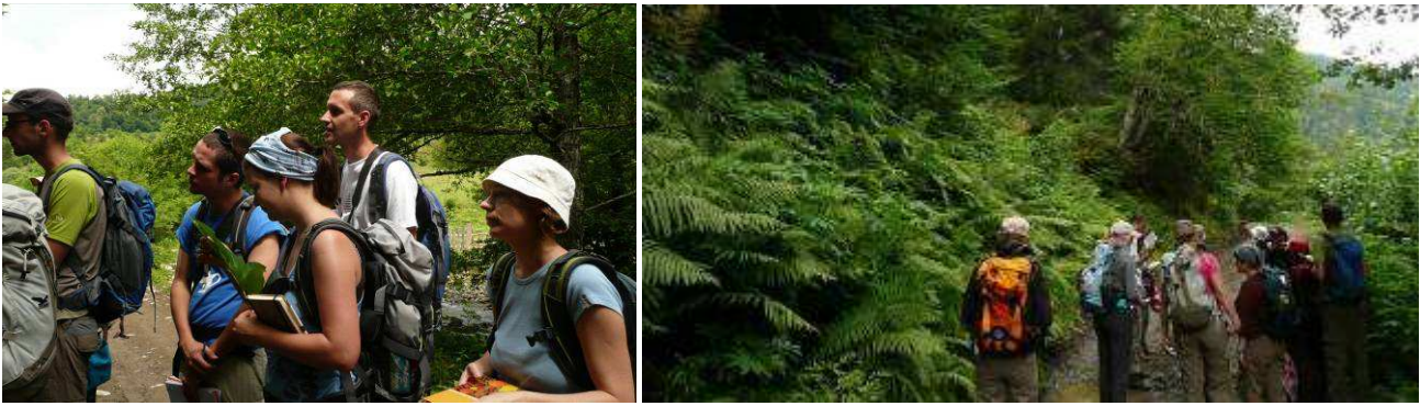
Abb. 10: In der Schlucht Baniskhevi (Kleine Kolchis).