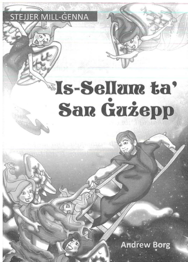
Is-Sena li għaddiet din il-Legġenda ta' San Ġuzepp ġiet ippublikata f'għamla ta' ktieb għat-tfal b'kitba tas-Sur Andrew Borg

Mela! Skont il-Legġenda, l-Anġli Ghassiesa 8 , kienu ilhom jinnutaw erwieh li żgur ma kienux dahlu mill-Bibien Ġawhrin tal-Ġenna. Għaldaqstant, bdew jistaqsu u fl-istess hin jiċċekkjaw ma'xulxin halli jaraw min, u minn fejn u kif, kien qiegħed idahhal fil-Ġenna dawn l-erwieh. Qatgħuha li jsahhu l-għassa ma' kull rokna tal-Ġenna. Lejl minnhom, fuq wieħed mis-swar, lemhu dell jixbah lil ta' raġel, imgeżwer f'mantar iswed u bil-barnuża mtella', donnu qed jgħin lil xi hadd (ruh) jaqbeż minn fuq iċ-ċint għal ġewwa. Dlonk, tnejn mill-Anġli, ittajru, u qabżu fuq din il-persuna, filwaqt li qalu: "Issa qbadniek fil-fatt! inża' l-barnuża, uri wiċċek!". Mistagħġba, indunaw li kien San Ġuzepp!