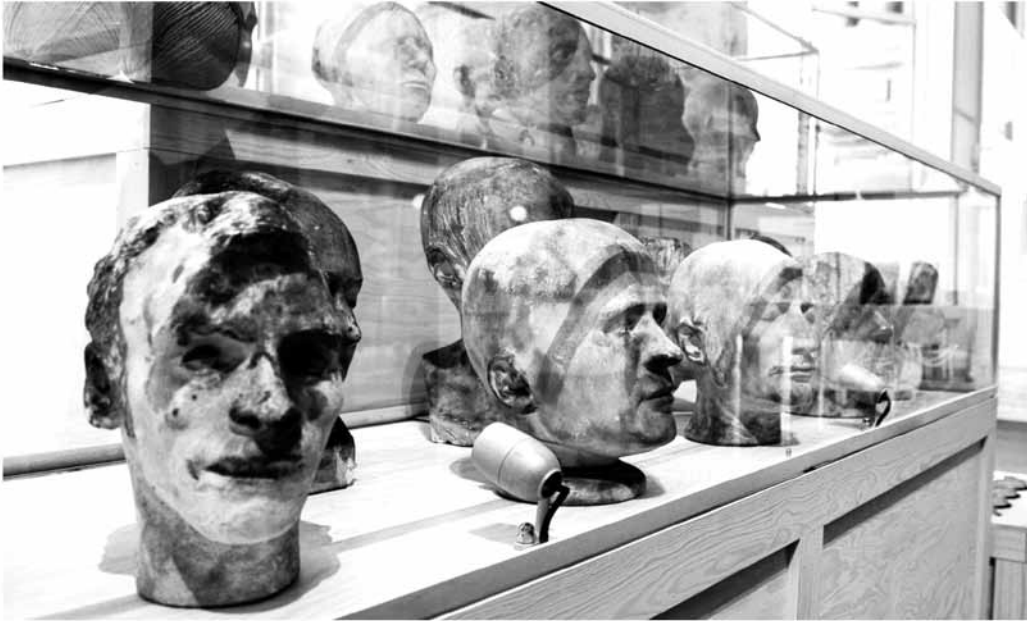
Utställningen (O)mänskligt, om rasbiologi, visades på Etnografiska museet 2010.

Skärmdump från experterna Lind, Wahlqvist & Östbergs artikel i Svenska Dagbladet (2016).