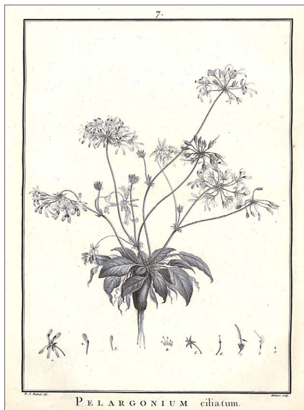
Fig. 3: Pelargonium ciliatum, burin sur cuivre, dessiné par Pierre-Joseph Redouté et gravé par Pierre Maleuvre, in: L'Héritier de Brutelle, Geranologia, Paris, Didot [1787-1788]

Après la mort du botaniste, sa bibliothèque est dispersée en diverses étapes. Au mois de septembre 1800, le Muséum d'histoire naturelle fait part au gouvernement de son intérêt pour « le plus riche dépôt de livres d'histoire naturelle jamais formé en France » 24 . Une commission est donc formée afin d'estimer la collection, dont les 7389 volumes sont évalués à 50000 francs par Desfontaines en novembre. Une entente s'ensuit entre le Muséum et la famille L'Héritier, mais elle ne sera que de courte durée. Les descendants souhaitent livrer les tomes uniquement par lots, au fur et à mesure que s'effectue leur règlement. Le Muséum