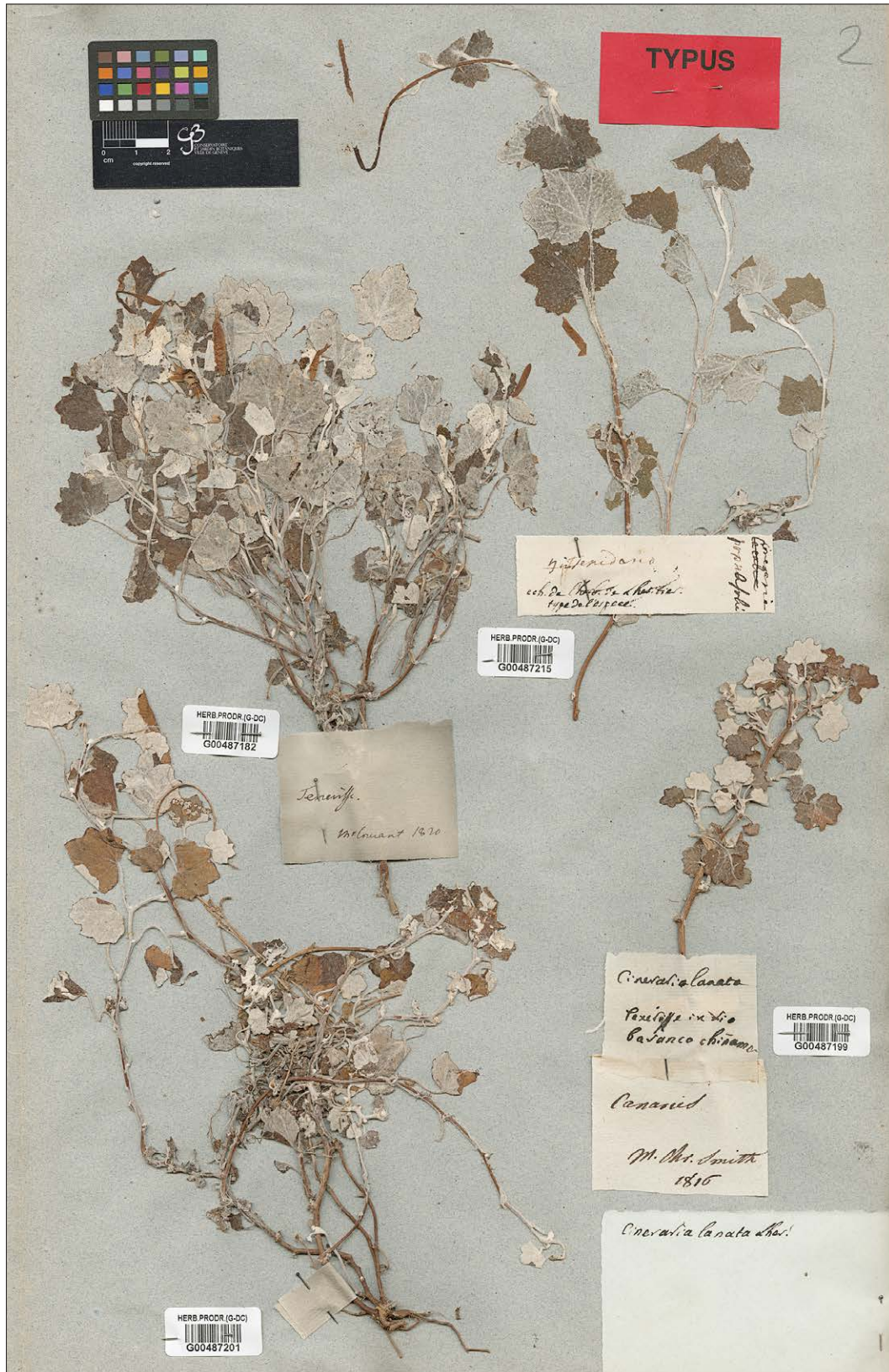
Fig. 4: L'échantillon en haut à droite, collecté avant 1800, est le type de l'espèce nommée Cineraria lanata par L'Héritier. En bas à droite, en revanche, une récolte du botaniste norvégien Christen Smith datant de 1816. En haut à gauche, un échantillon récolté en 1820. Cette plante endémique de Tenerife sera placée dans le genre Senecio par Candolle, sous le nom de Senecio heritieri DC. Un nouveau genre sera créé pour les séneçons à fleurs violettes des Canaries et de Madère : l'espèce de l'Héritier se dénomme actuellement Pericallis lanata (L'Hér.) B.Nord.