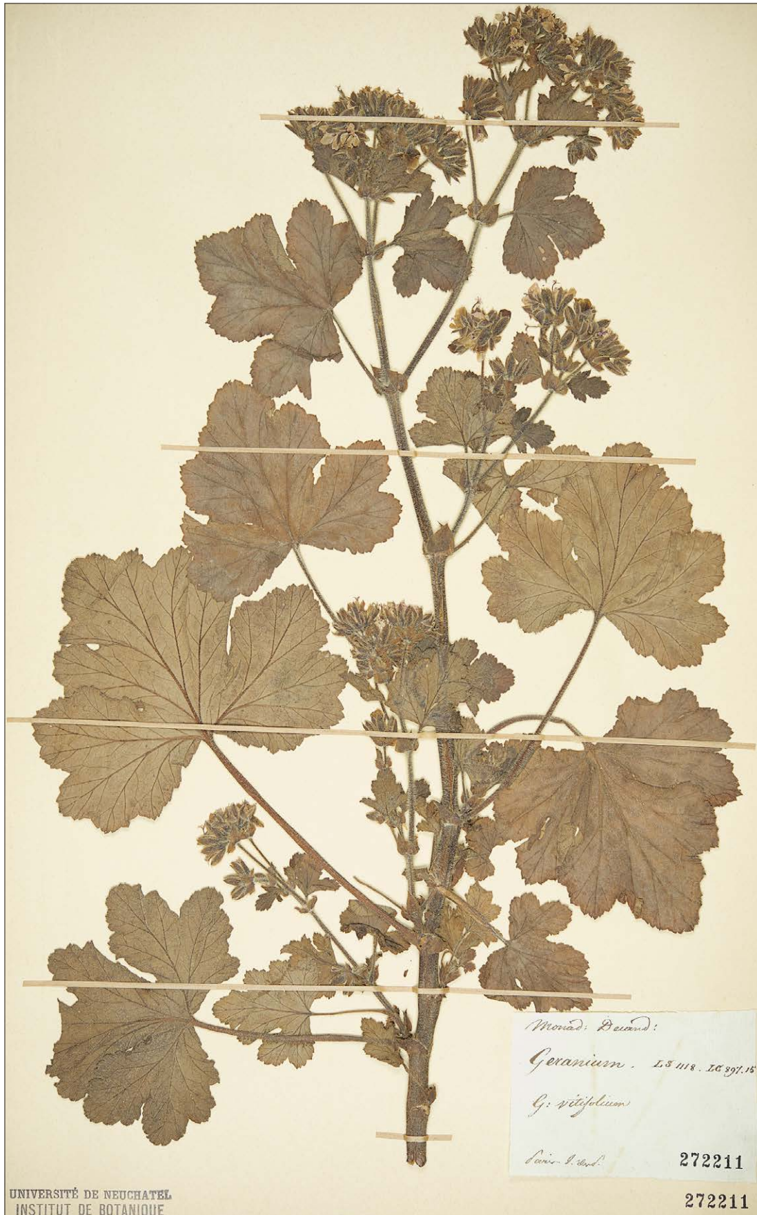
Fig. 6: Planche de l'herbier de Paul-Louis-Auguste Coulon, Geranium vitifolium , récolté au Jardin des plantes de Paris © Institut de botanique de l'Université de Neuchâtel.