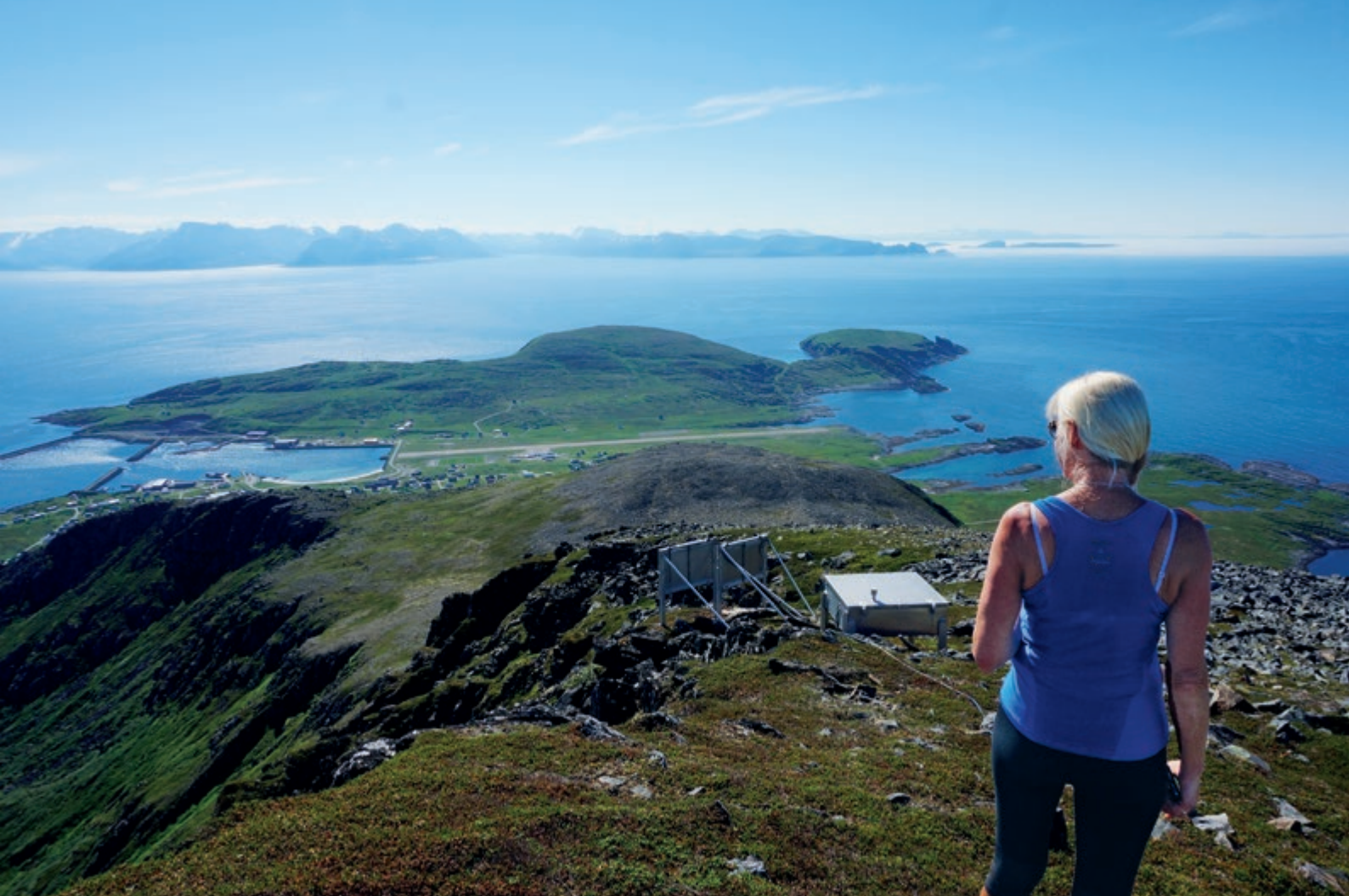
Utsikt fra Navaren med utsikt mot Hasvik og innover mot fastlandet og øyene Silda og Loppa.

kortbuksevær på Navaren, med utsikt mot Hasvik og innover mot fastlandet og øyene Silda og Loppa.