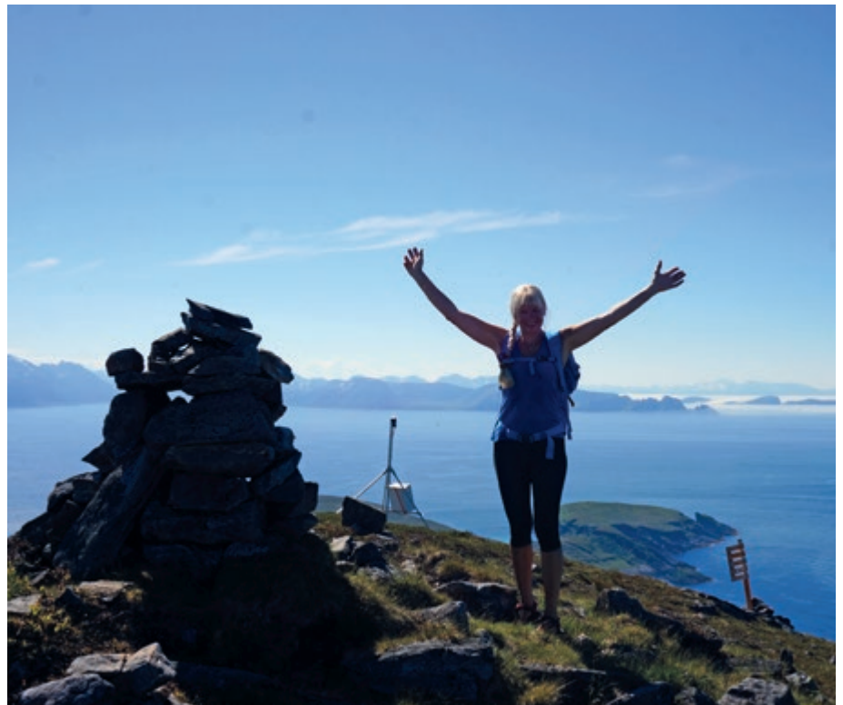
På toppen av Navaren., 491 m eter over havet.

Navaren (1) er den 491 m høye toppen, som ligger rett ovenfor tettstedet Hasvik