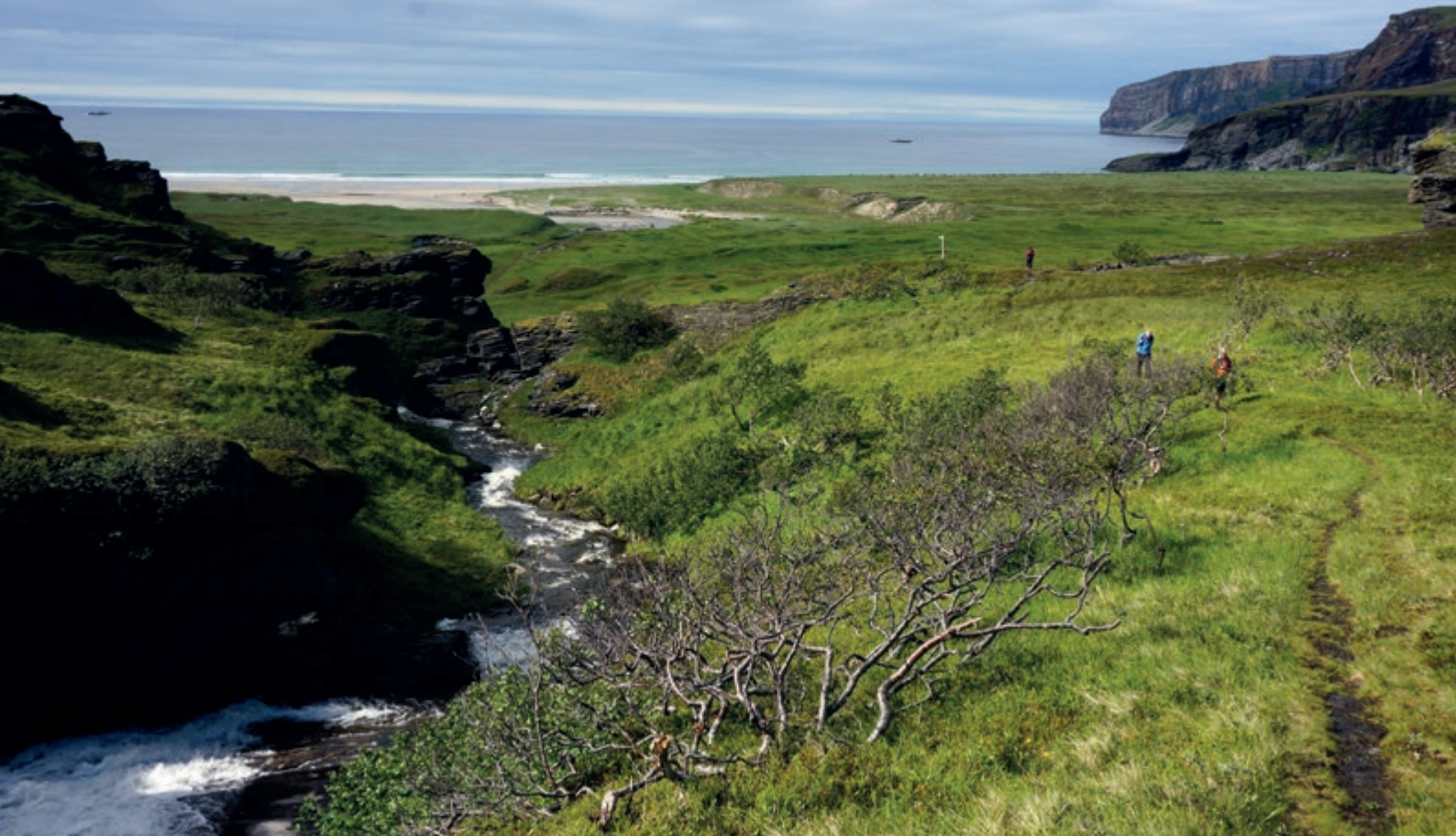
Nordsandfjorden – den ene av de to endearmene av Sandfjorden på nordvestsiden av Sørøya.

på sørvestenden av Sørøya. Det er et fantastisk utsiktspunkt – når været er bra. Man ser ikke minst over Sørøysundet mot øyene Loppa og Silda, og ellers fastlandet i Loppa kommune, lant annet med den 1204 m høye breen Øksfjordjøkulen. Toppen kan bestiges rett opp fra Hasvik, men vi ble anbefalt å gå fra nordsiden. For en tur – og da smakte vår medbrakte cava ekstra godt!