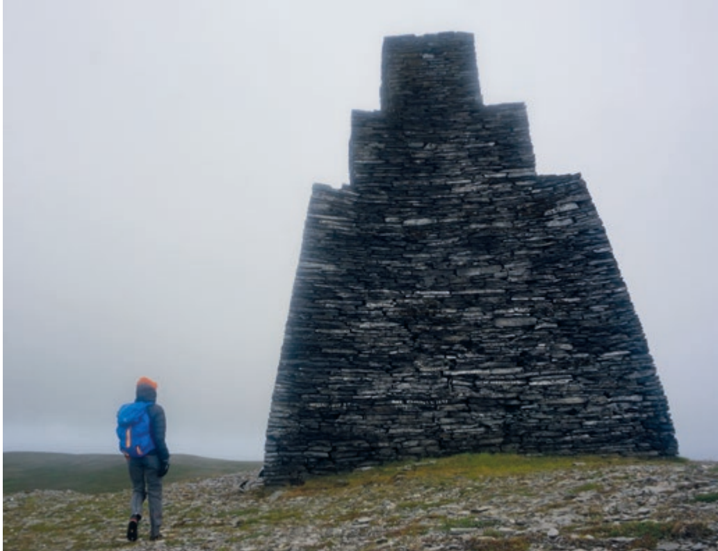
Den mer enn 12 m høye Kjøttvikvarden er det eldste byggverket i Hammerfest kommune.