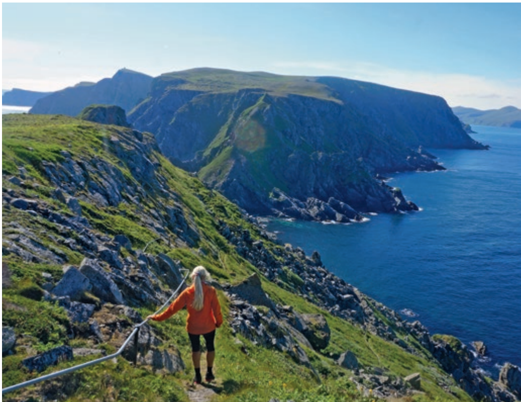
Tarhalsen er den aller nordligste odden på Sørøya og dronningen åpnet Fyrvokterveien i juni 2016.