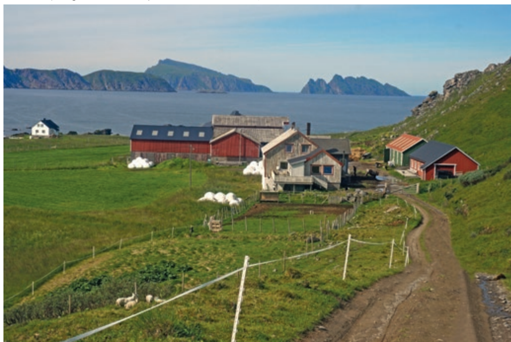
Gamvik Gjestegård i Gamvika på nordøstsiden av Sørøya.

Gården Gamvik Nordre og Gjestegård ligger i Gamvika, helt på nordøstsiden av Sørøya. Den har vært i aktivt bruk til jord-